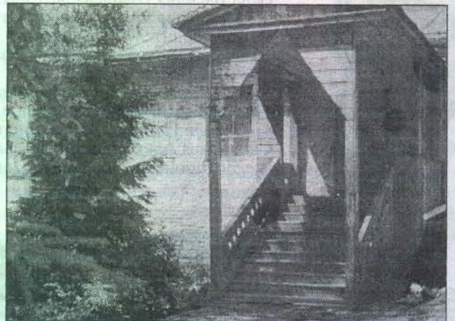
Училище в Промзипо, основанное И.Н.Ульяновым (ныне Сурский краеведческий музей).