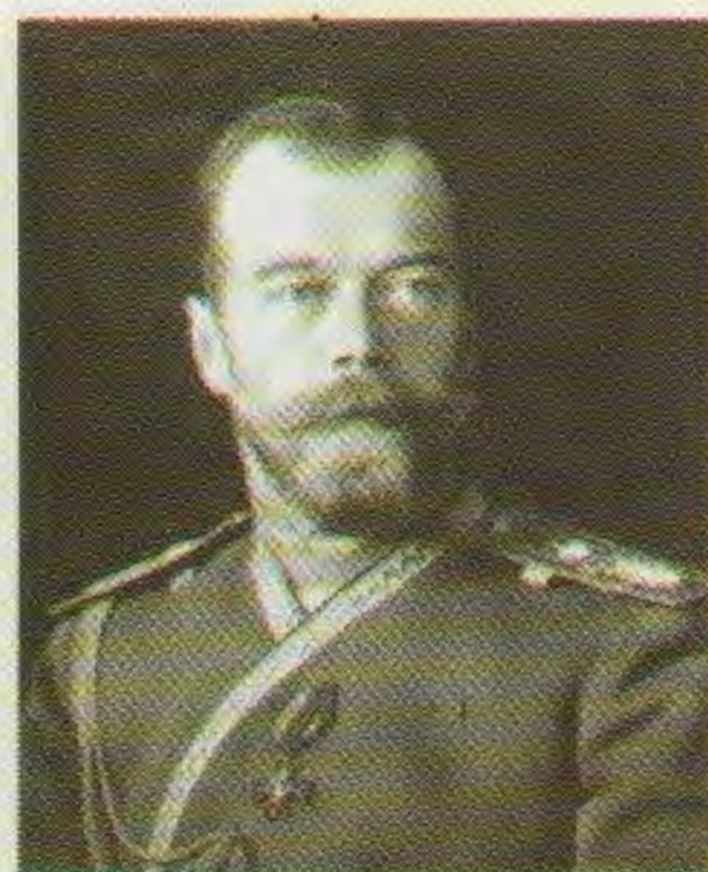
Николай II Александрович Страстотерпец (1894–1917)