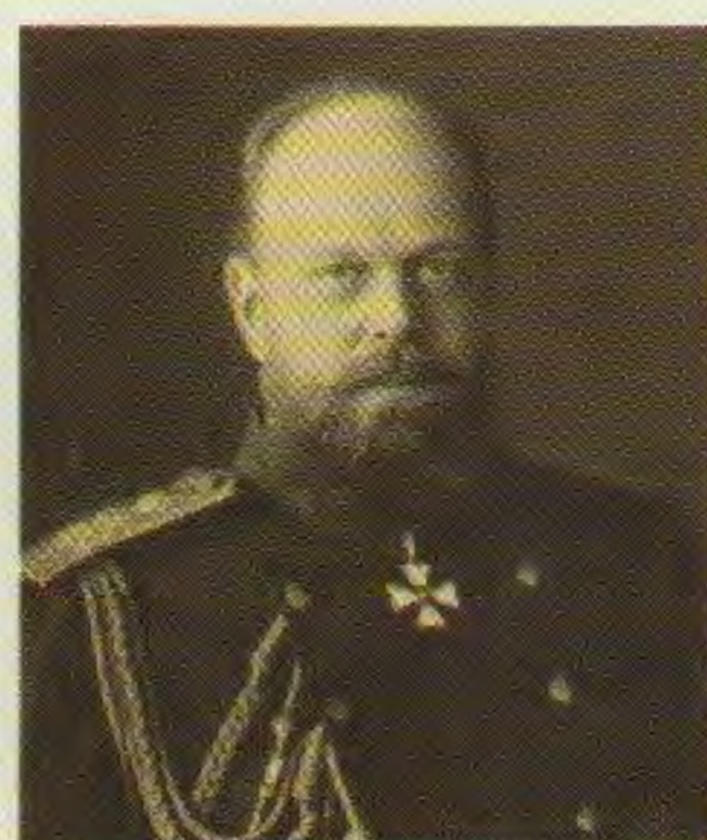
Александр III Александрович Миротворец (1881–1894)