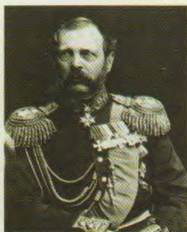
Александр II Николаевич Освободитель (1855–1881)

Александр II посещал Симбирск дважды. Первый раз летом 1837 года (еще будучи наследником), второй – в сентябре 1871 года (проездом на Кавказ). В память второго посещения Симбирска императором городская дума учредила две стипендии Его Величества на содержание воспитанников из бедных жителей города.