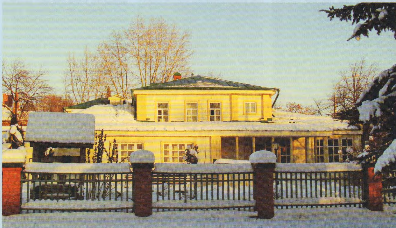
Бывший дом В.В. Черникова на Московской улице. В 1867–1885 гг. здесь располагалась его частная типография. Сейчас – музей «Симбирские типографии».

В 1855 году новым императором России стал Александр II. Страна, униженная позором поражения в Крымской войне, встала на путь реформ. О чем следовало заявить обществу – но как, если на протяжении десятилетий в Российской империи действовали крайне жесткие цензурные правила? Для того чтобы открыть типографию, следовало получить разрешение министра