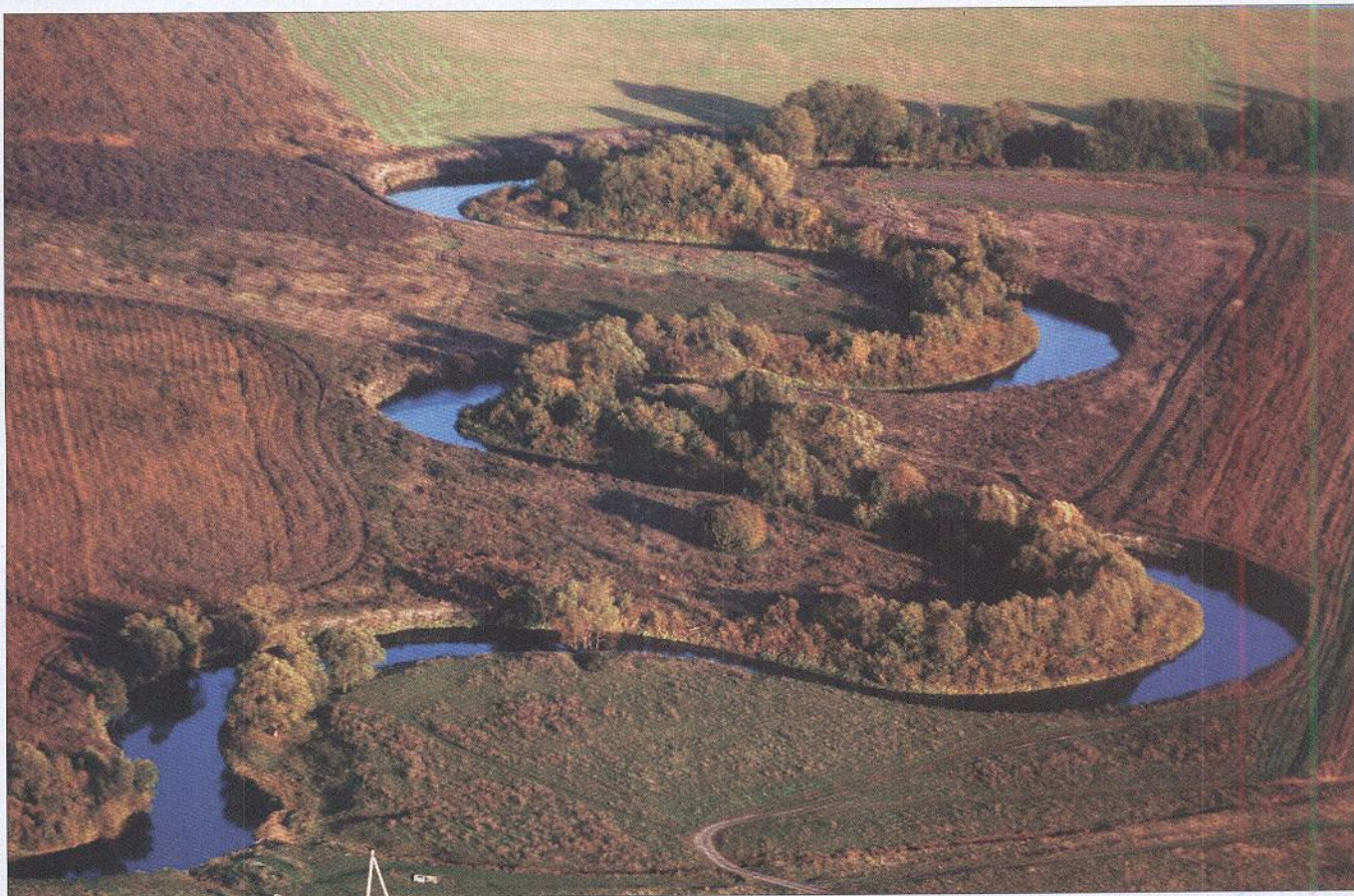
Река Свияга от места впадения в неё речки Гуши (село Спешневка) и до Ульяновска