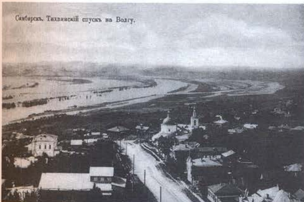
Самарск. Тихвинский спуск на Волгу.

27 апреля 2017 г. в Областном музее народного творчества (при ЦНК) состоялось открытие выставки.