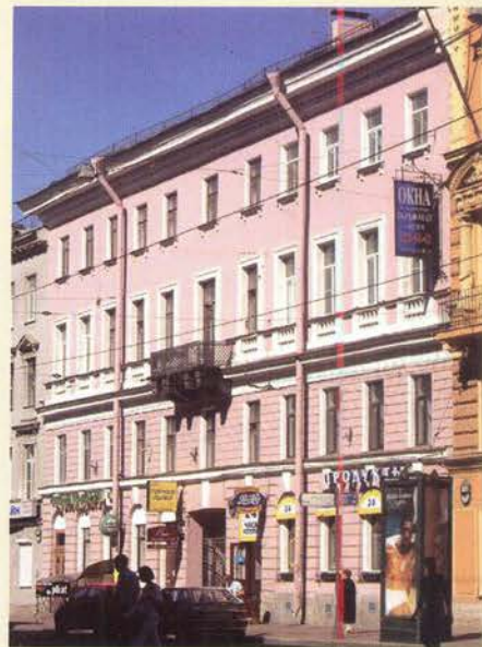
Дом Шамшева, Литейный, 52

В конце 1856 или в начале 1857 года он переезжает в квартиру на ул. Моховой, 3, в дом, который принадлежал чиновнику Министерства иностранных дел, тайному советнику Михаилу Михайловичу Устинову (1800–1871). Дом находился в I квартале Литейной части Петербурга. Точная дата переезда неизвестна, но в письме М.Н. Каткову от 21 апреля 1857 года Гончаров пишет: «Живу я всё там же, т. е. на Моховой улице, близ Сергиевской, в доме Устинова». Из этих строк ясно, что живёт Иван Александрович на Моховой