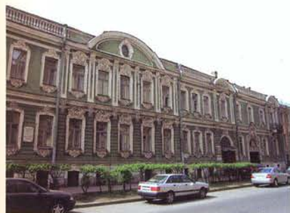
Ул. Моховая, 3. Современный вид

перестраивалось в 1851 и 1855 годах архитектором Г.А. Боссе.