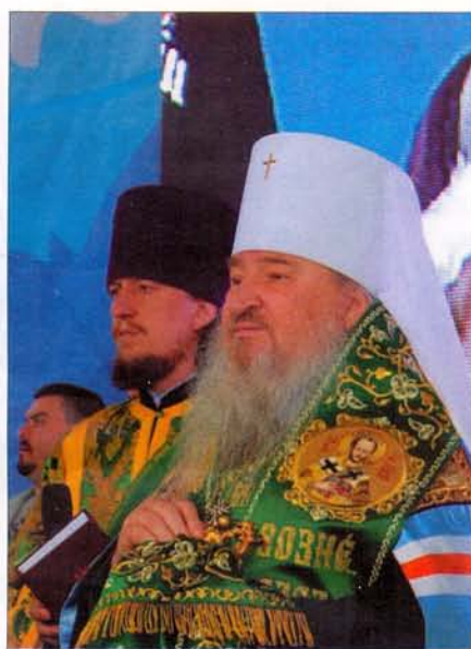
Молебен в День России и День города. Ульяновск. 12 июня 2014 года

Что же пожелать творческому коллективу журнала? Как человек, вновь прибывший на Симбирскую землю, как новый архипастырь хочу сказать: продолжайте то доброе дело, которое уже многие годы вы ведёте! Продолжайте и углубляйтесь. Я надеюсь, что ваш