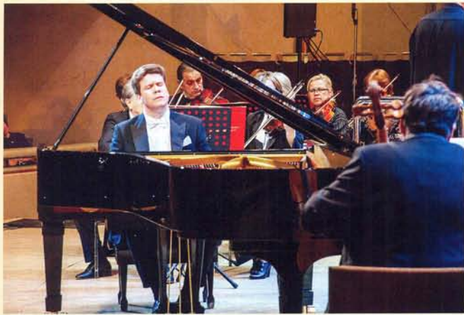
«От всей души»