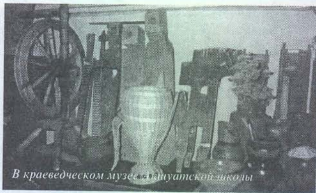
В краеведческом музее Акшутской школы