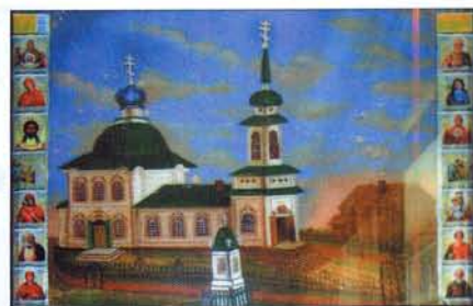
Сретенская церковь в с. Беклемишево после частичного восстановления. Сохранилась лишь средняя часть сооружения.

Так выглядел храм в начале XX века. Картина Н. Дубова