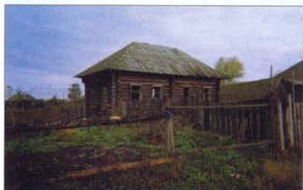
Дом, в котором родился и вырос автор статьи. Фото 1970 и 2013 годов