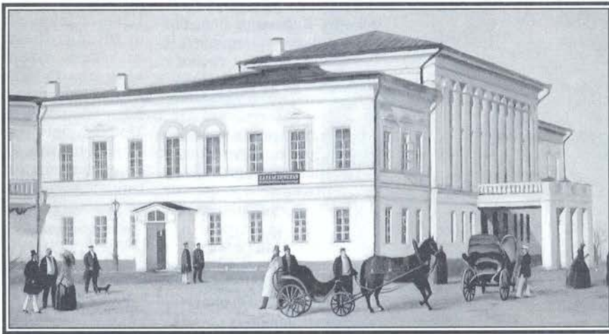
Карамзинская общественная библиотека

Женитьба принесла материальную обеспеченность и создала благоприятные условия для дальнейшего творчества. Большую часть времени Карамзин с семьей проводил в Оста-