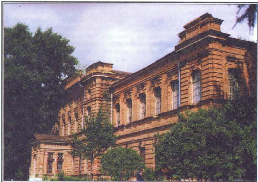
Фасад центрального корпуса Карамзинской психоневрологической больницы.

фьево. Здесь, в просторном кабинете именин Вяземских, будет создаваться «История государства Российского».