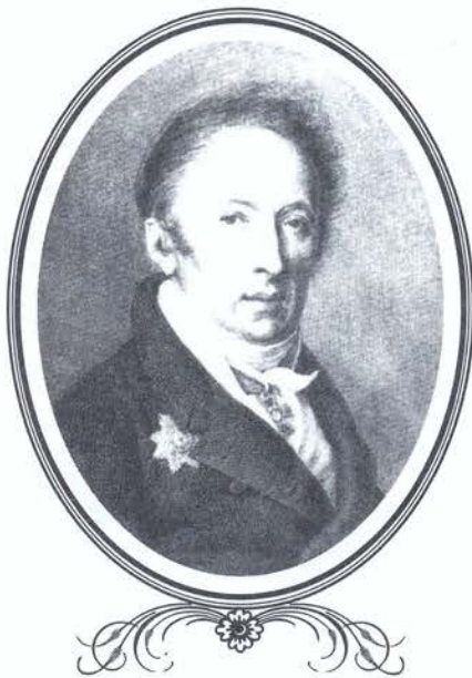
Н.М. Карамзин.

Самый важный эпизод детства – тот, что описан в «Рыцаре нашего времени»: возвращаясь во время сильной грозы из леса, мальчик с дядькой наткнулись на медведя; от страха и ужаса ребенок потерял сознание в тот самый момент, когда блеснула яростная молния, а, очнувшись, увидел