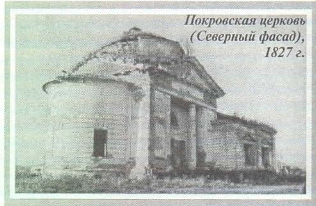
Покровская церковь (Северный фасад), 1827 г.

Небольшая звонница на куполе храма, не имевшего особой колокольни (своеобразный и редкий вариант "церкви под колоколы"), возвышалась над окружавшими купол с четырех сторон трехугольными фронтонами двухколонных портиков. Они придавали особую выразительность храму, имевшему фор-