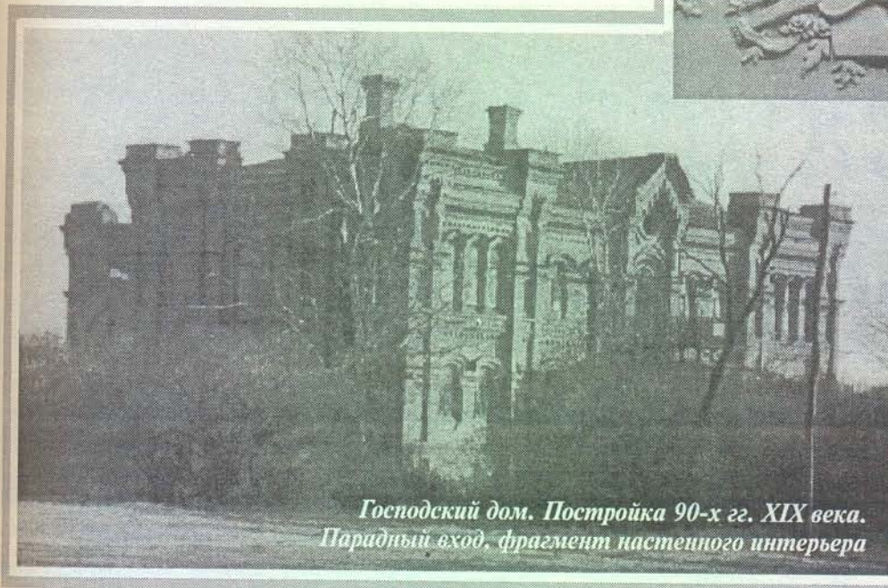
Господский дом. Постройка 90-х гг. XIX века. Парадный вход, фрагмент настенного интерьера

равнодушие к Церкви, ее украшению, к спасению своей собственной души. А за этим следуют: презрение к своим духовным наставникам, стремление их унижить насмешками и грубыми оскорблениями, глумление над всем дорогим и святым для каждого ис-