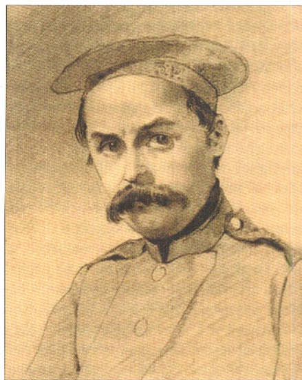
Тарас Шевченко. Автопортрет. 1847