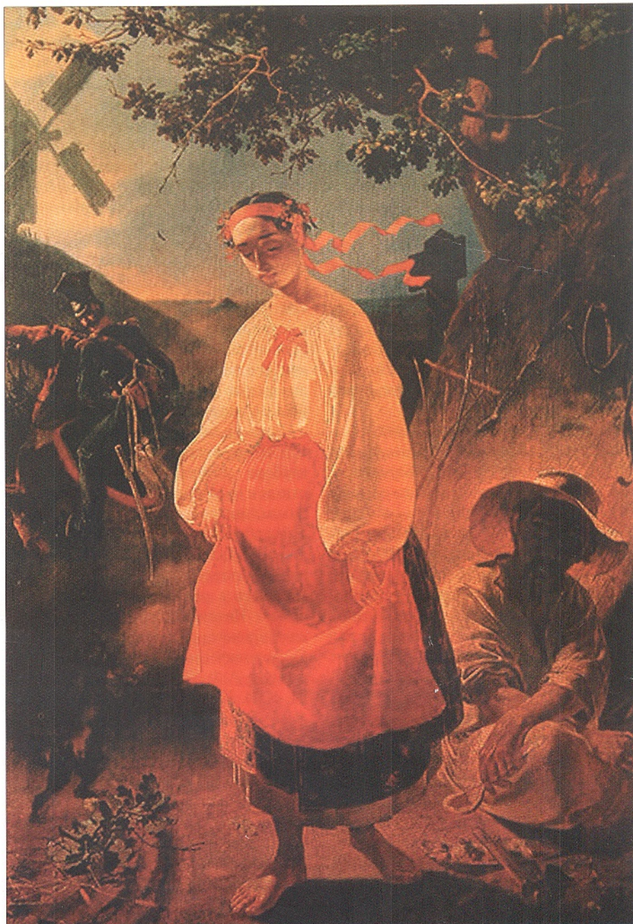
Тарас Шевченко. Катерина. 1842

Сергей Тимофеевич давно уже интересовался культурой украинского народа, высоко ценил он и творчество Тараса Шевченко, знал о его судьбе по рассказам друзей и знакомых: гениального русского актёра М.С. Щепкина, писателя П.А. Кулиша и других.