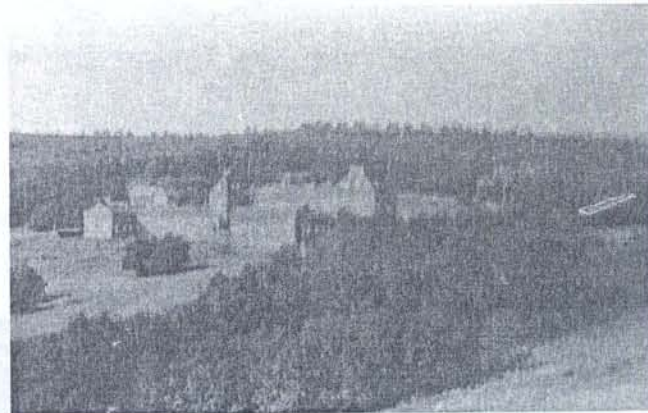
Вид на Карамзинский поселок