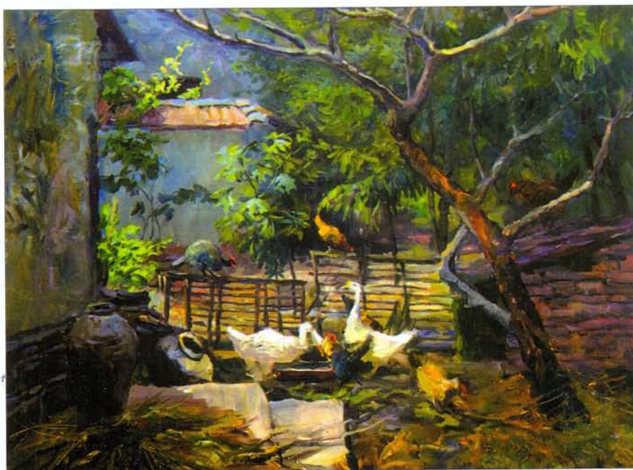
А. Мишов. Китайский дворик. 2012

Пытаясь освежить свою палитру, Андрей Викторович часто ездит в Крым, Черногорию. Пейзажи «Лодочная станция», «Гурзуф», «Виноградники», «Форос» демонстрируют развитие живописных качеств художника. На юге написано много натюрмортов: «Ирисы в саду», «Сирень», «Подсолнухи» и другие. Все они отличаются сочной, густой живописью, несущей в себе праздник окружающего мира. Но художнику ближе родная природа средней полосы России. Он часто ездит с этюдником в Подмосковье. Тонко написан пейзаж «Коломна», он передает красоту заснеженного берега, отраженного в реке, лиризм и очарование наступающей зимы. Пейзаж «Церковь в Абрамцево» полон света и ностальгии, ведь в Абрамцево жили и творили С. Мамонтов, В. Серов, М. Врубель, Ф. Шаляпин. Боровский монастырь – это этапная работа в творчестве художника. Картину Андрей Викторович назвал «Припорошило». Картина величава и драматична, архитектура монастыря с колокольной вписывается в серое небо. Могучая ель задумчиво нависла над присыпанным снегом сиротливым кладбищем. Эпической силой и простором веет от пейзажа «Подол», написанного художником поздней осенью вблизи города Вышний Волочёк. Картина «Март» передает волнующее ощущение приближающейся весны.