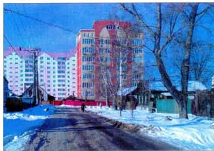
Переулоч Устинова. 2013