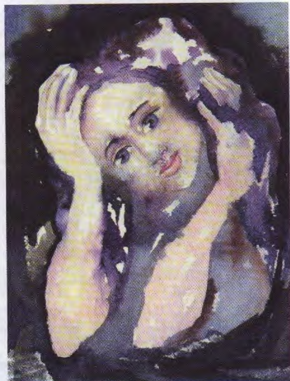
Первая грусть. 1990