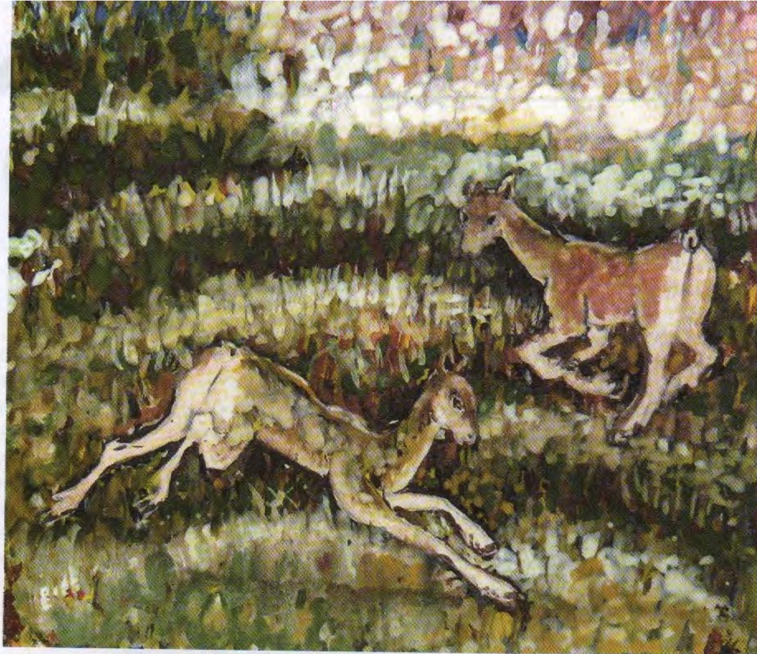
Игра. 1990. Акварель, гуашь, картон, 24,5x28,2