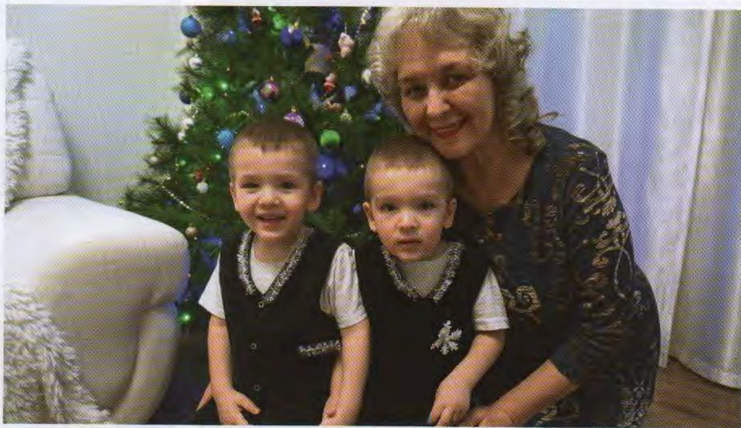
С внуками. Жизнь продолжается