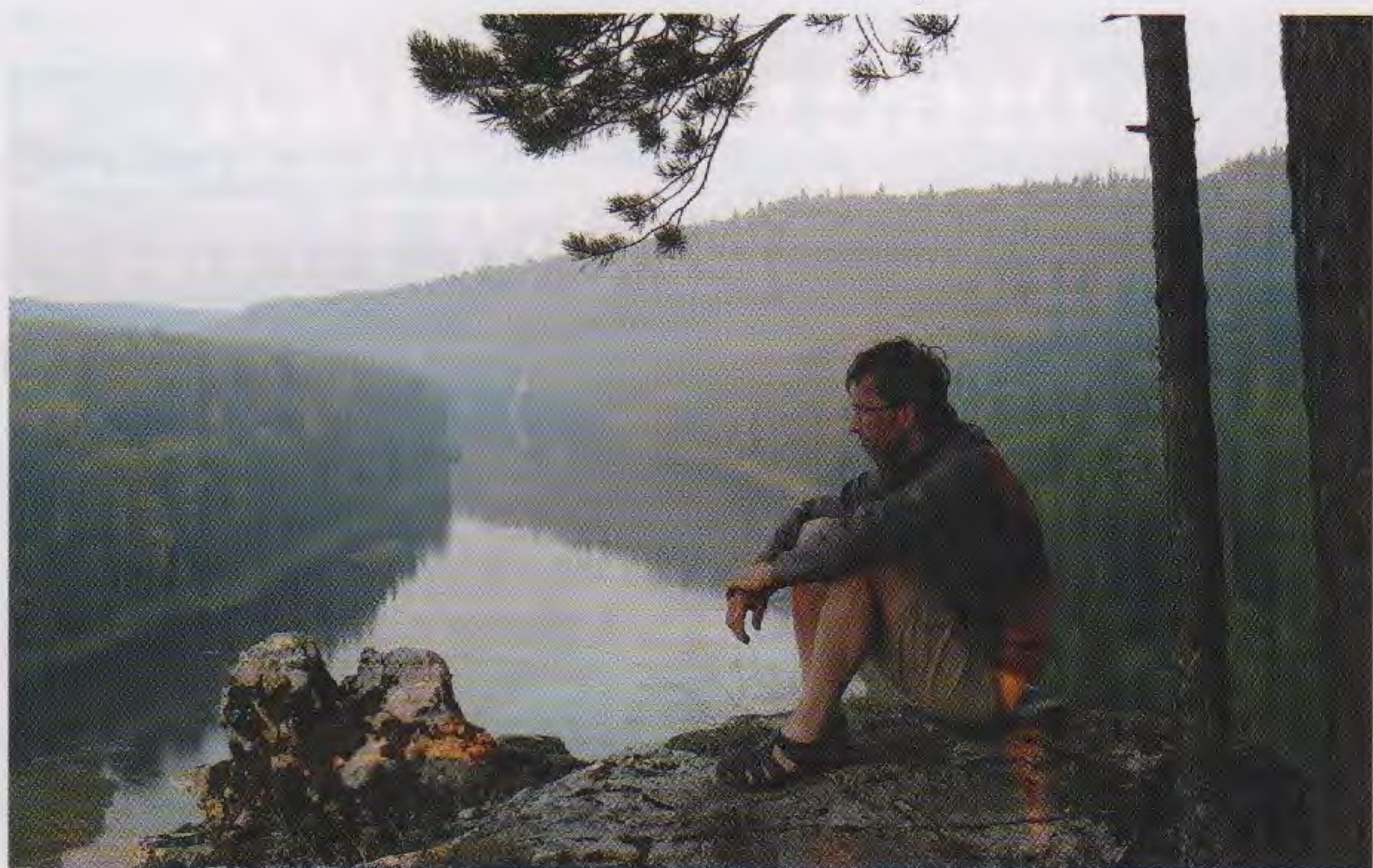
Путешествие с фотоаппаратом.

– В период пандемии мы перестроили свою работу. От части мероприятий в этом году нам пришлось отказаться или перенести их. Но появились новые планы. Когда пандемия только началась и медики приняли