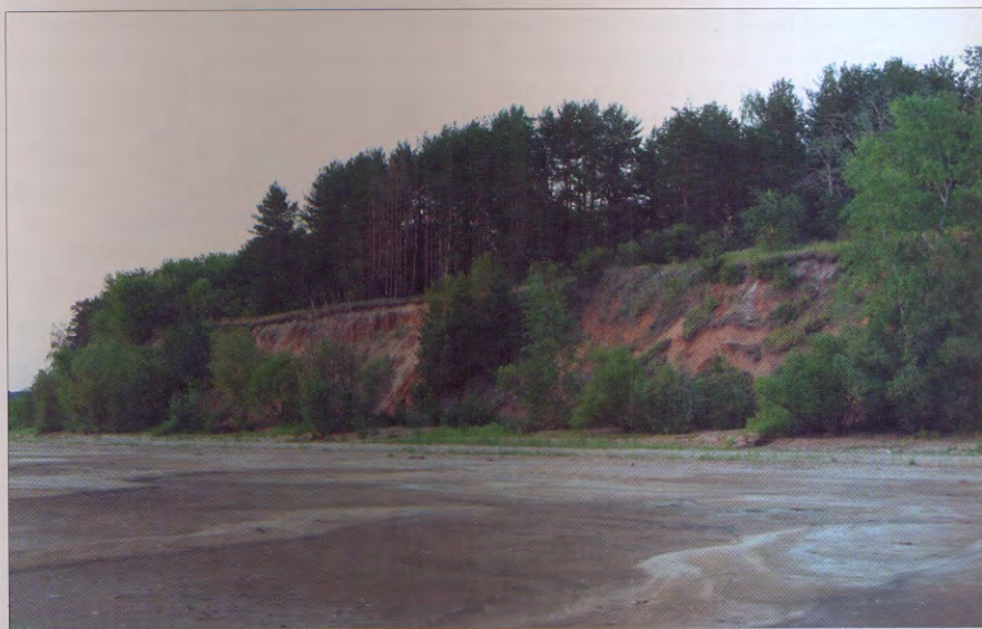
Берег Старомайского залива Волги

Головкинские острова возникли в середине 1950 годов после образования Куйбышевского водохранилища. А раньше это была прибрежная земля, где располагалось одно из богатейших