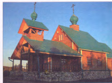
Успенский храм на территории турбазы «Русский берег» в Старомайнском районе

Но чудеса старомайнской земли не заканчиваются и на этом. Огромный интерес вызвала находка статуэток индийского бога Вишну, датированных VII–X веком, которые подтверждают