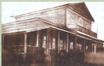
Дом, в котором жил Д.В. Давыдов. 1885

Сотрудниками Ульяновского областного краеведческого музея проведено комплексное научное исследование территории, начато формирование коллекции и архива. Организовано хранилище для приёма предметов музейного значения, завершается подготовка проектно-сметной документации. Усадьба будет воссоздана на основе воспоминаний, писем, документальных, журнально-книжных и иных источников. Большую помощь в воссоздании облика усадьбы Давыдовых оказывают фото и воспоминания потомков поэта-партизана, совместная работа всех неравнодушных и заинтересованных людей.