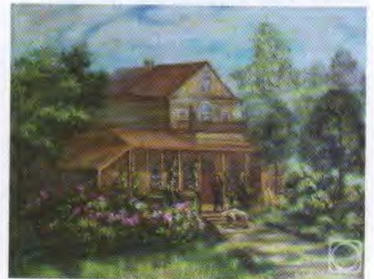
Верхняя Маза. Дом Давыдовых в Верхней Мазе. Худ. И. Зайцева (с фотографии 1885 г.)

В это время Денису Давыдову принадлежали доставшиеся от отца родовые имения и 124 крепостные души в Ливенском уезде Орловской губернии. В «Общем Гербовнике дворянских родов Всероссийской империи» записано: «Фамилия дворян Давыдовых происходила от выехавшего к Великому Князю Василию Дмитриевичу из Золотой Орды Минчака Косаевича, а по крещению