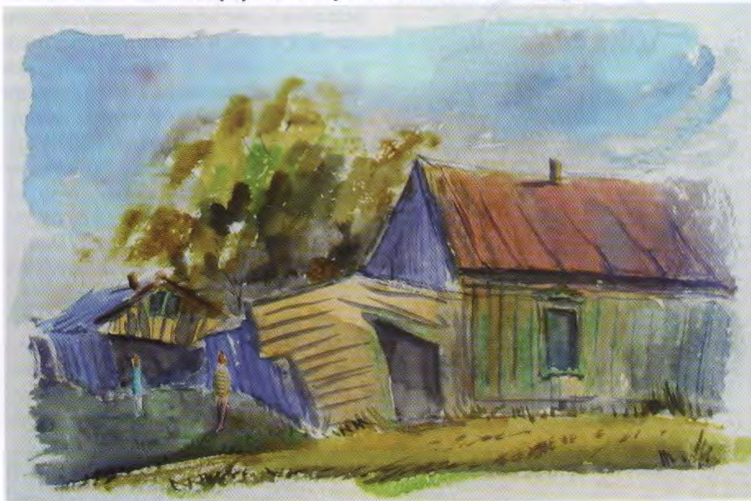
Вернулись. Зброшенны дом в Белом Яре

Я «ностальгетик» – внутри какой-то интерес к определенным периодам истории, мне хочется побывать в том или ином времени, почувствовать ту жизнь, о которой мне рассказывали. Наверное, с помощью рисования я в нее как раз и погружаюсь. А если рисую разваливающийся одинокий дом, иногда даже изображаю людей, которые хотят его восстановить. Я воспринимаю дома как живые существа. Помню, как по пути от разрушенной пристани к главной улице я остановилась, услышав равномерный звук: где-то что-то скрипело и постукивало. Оказалось, что это под крышей старого дома открывалась и закрывалась дверка. Туда-сюда, туда-сюда. Звук был гулкий и одинокий среди бурного жужжащего