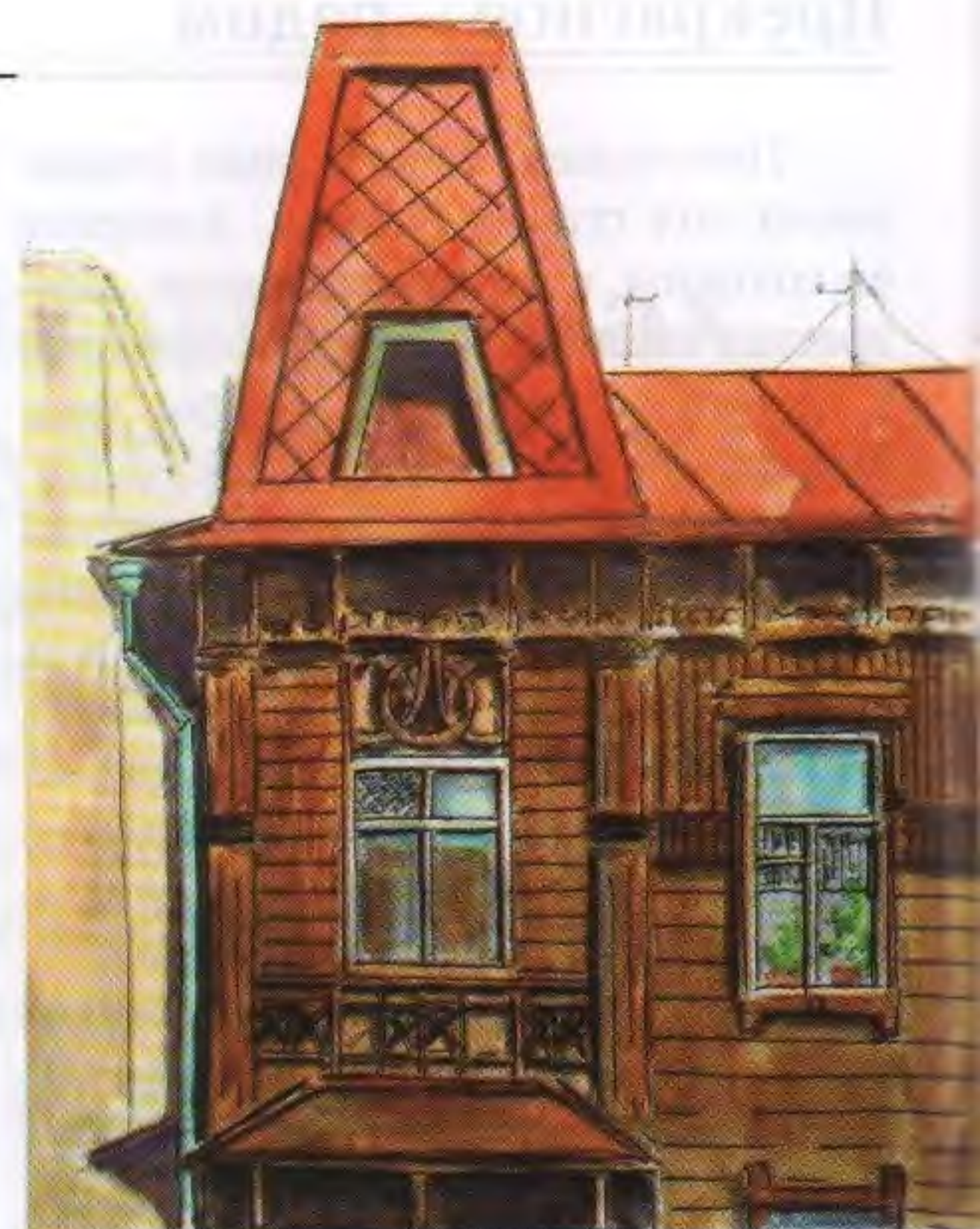
Ульяновск. Улица Радищева, 92

Тут и некий сюрреализм: так, поспав, Обломов видит Дом Гончарова из окна – жить-то он здесь не может, хотя это было бы логично, но тут уже музей.