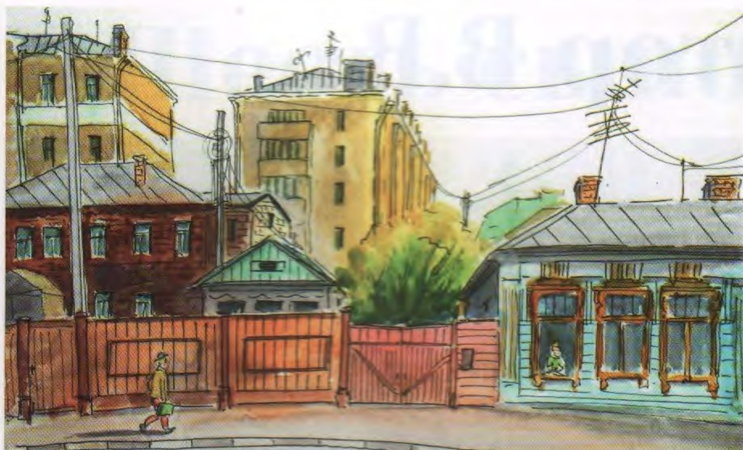
Ульяновск. Улица Ленина, «володарские» дома

я рассказываю истории старых домов Симбирска-Ульяновска. К сожалению, старые здания сносятся, а улицы застраиваются и теряют свое лицо. Даже за то время, что я рисовала, несколько домов было снесено. Получается, я успела сделать последние зарисовки тех или иных мест города, от этого особенно грустно. Но некоторым улицам повезло больше, например, улице Ленина. У меня много скетчей и пленэрных работ отсюда, некоторые можно увидеть на выставке одной улицы «Московская-Ленина», которая сейчас проходит в Доме-музее Ленина, расположенном на этой улице. Ко мне обращаются жители нашего города и те, кто когда-то здесь жил, говорят, как им дороги эти виды. Они покупают открытки с моими акварелями, а в прошлом году это был целый календарь с видами Ульяновска. Кстати, я провожу мастер-классы, на которых мы рисуем виды города, а