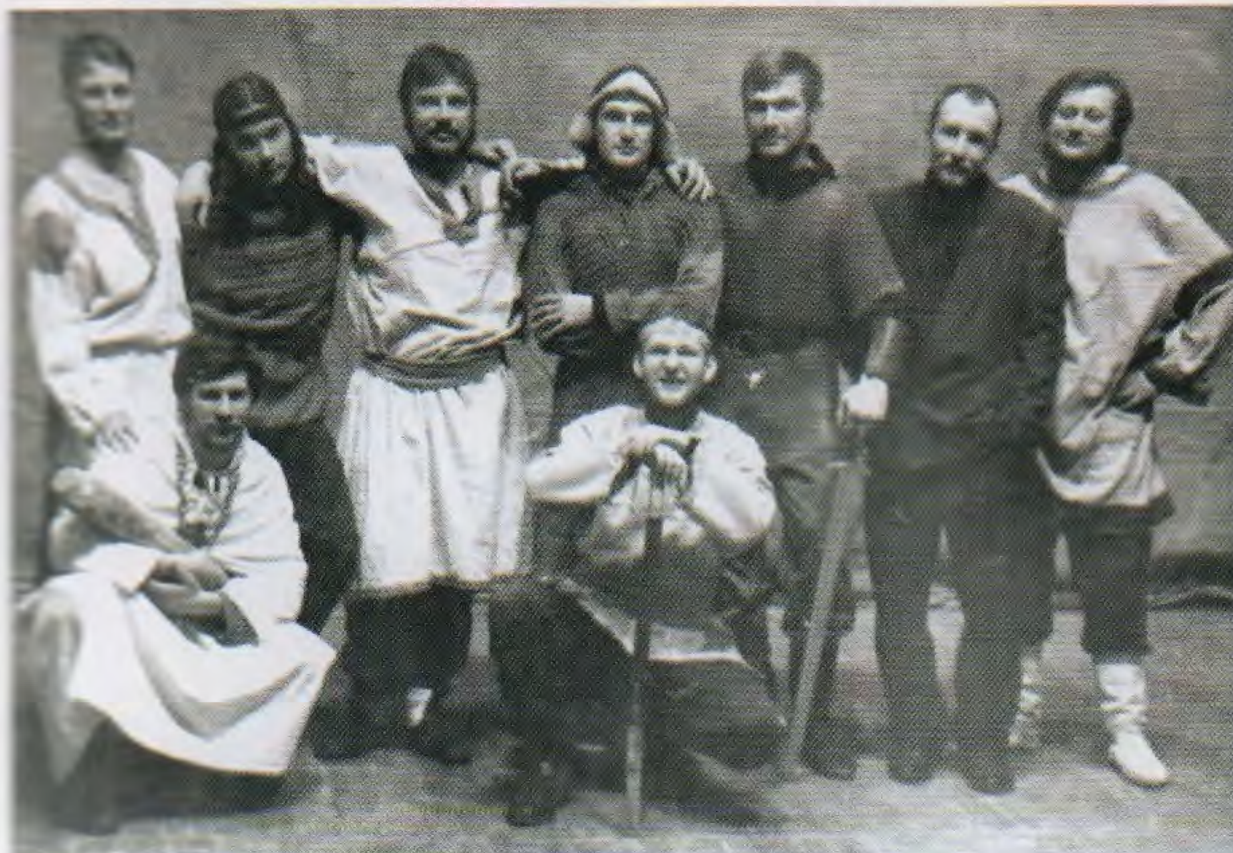
ВИК «Дружина «Рысь». Середина 1990-х

болкой» – ниже пояса и ниже локтей бить запрещалось. Но постепенно любители исторических боев в прямом смысле набивали шишки. Под кольчугу и латы стали надевать поддоспешники – плотные стеганые куртки, руки защищались латными рукавицами, щиты стали крепче. И забава стала оформляться в новый вид спорта, за которым на долгое время закрепилось название «историческое фехтование».