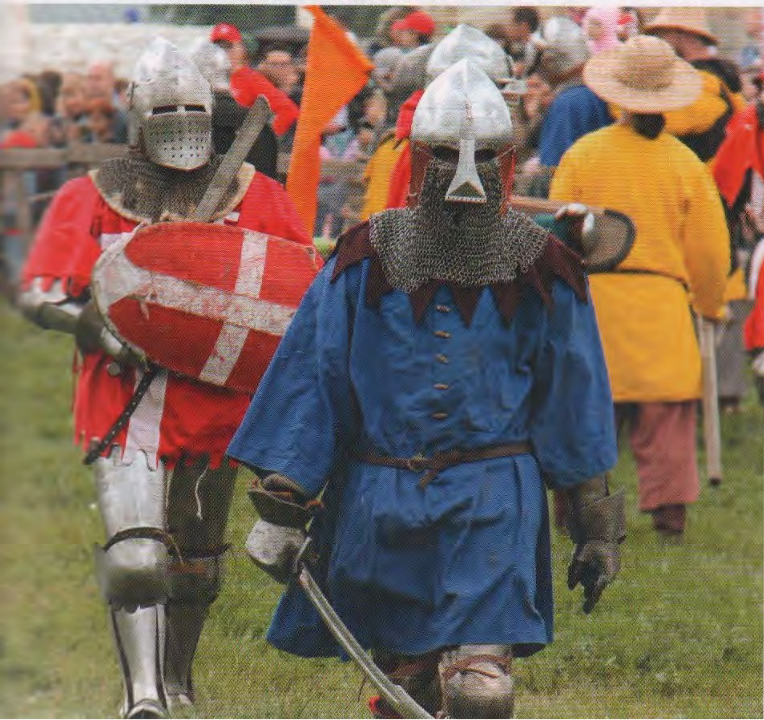
Фестиваль «Великий Болгар». 2019

– Чаще всего их наносят молодые бойцы, которые еще не знают толком, куда наносить удар. Опытный боец