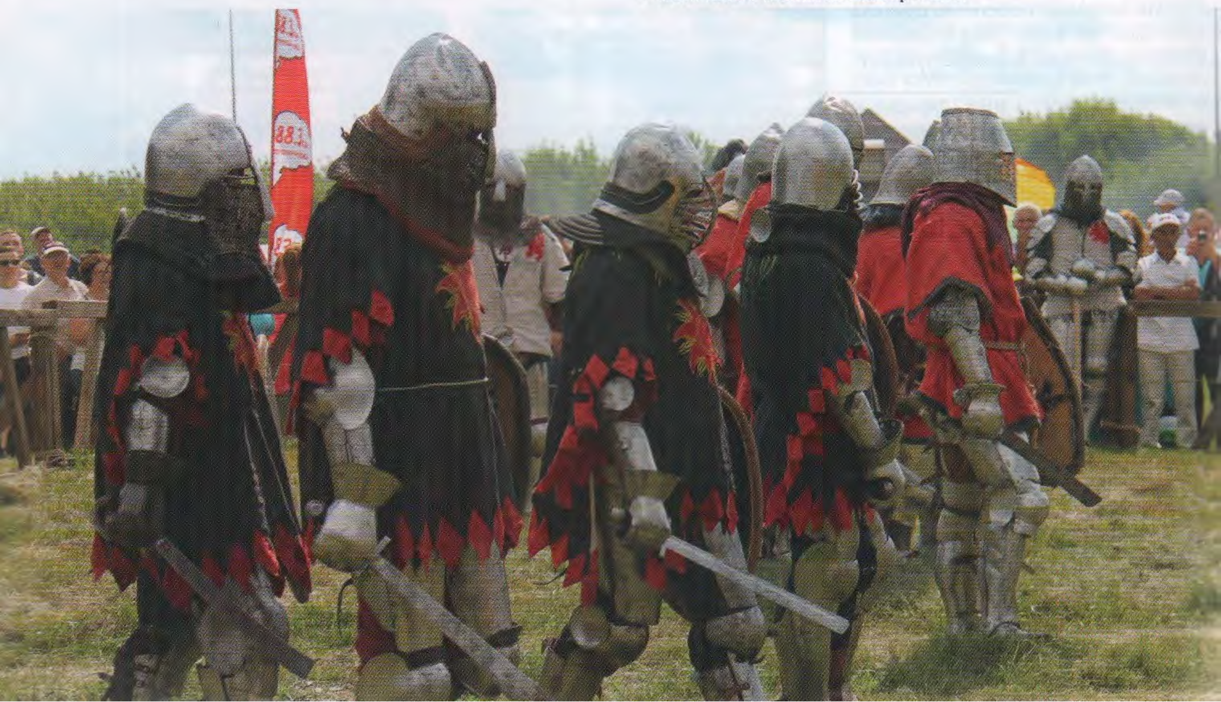
Фестиваль «Великий Болгар». 2017

Правда, заниматься этим спортом получится, скорее всего, только примерно лет с 15–16, когда подросток сможет надеть на себя доспехи, которые весят примерно 50 килограммов. Причем речь идет именно