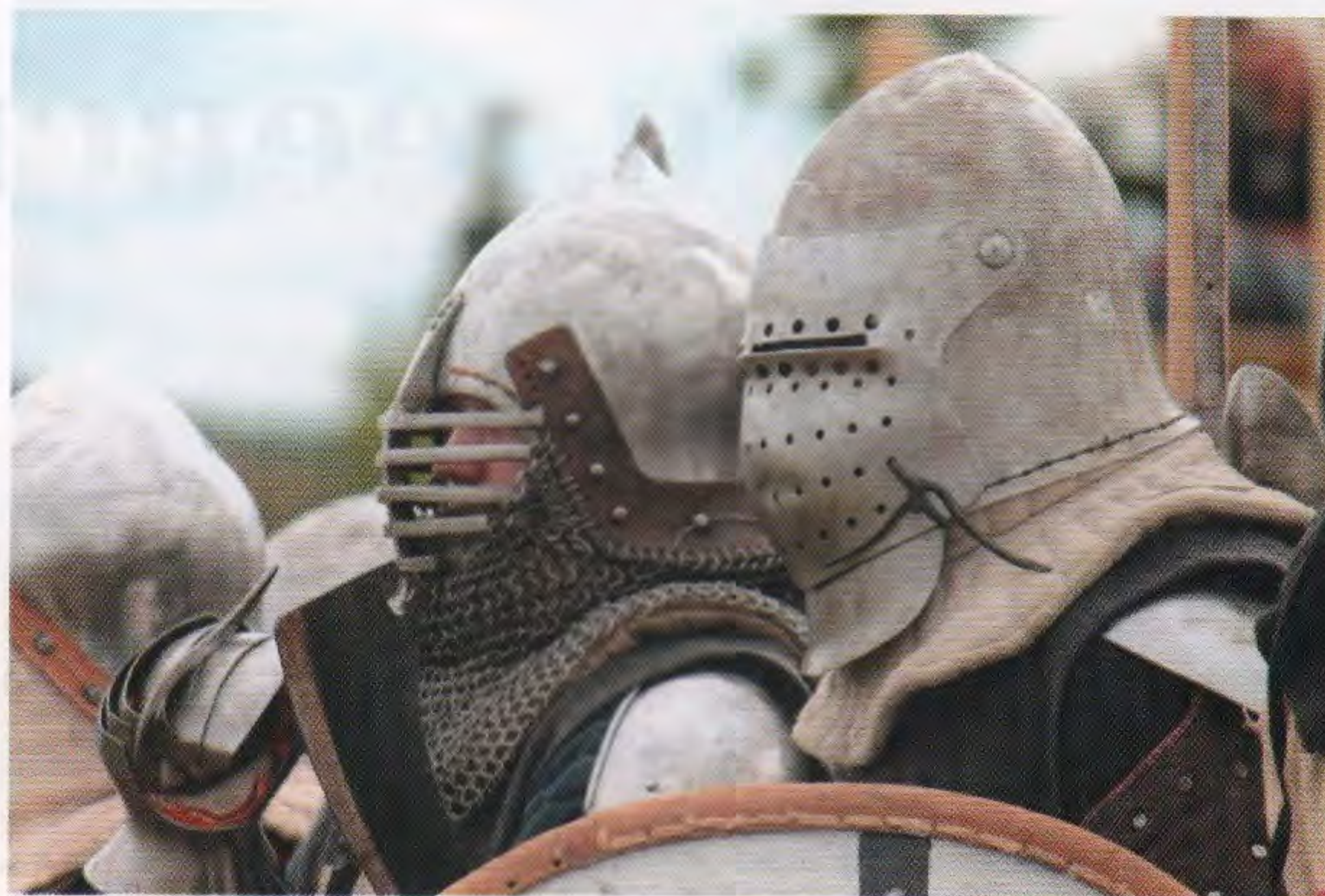
Фестиваль «Великий Болгар». 2015