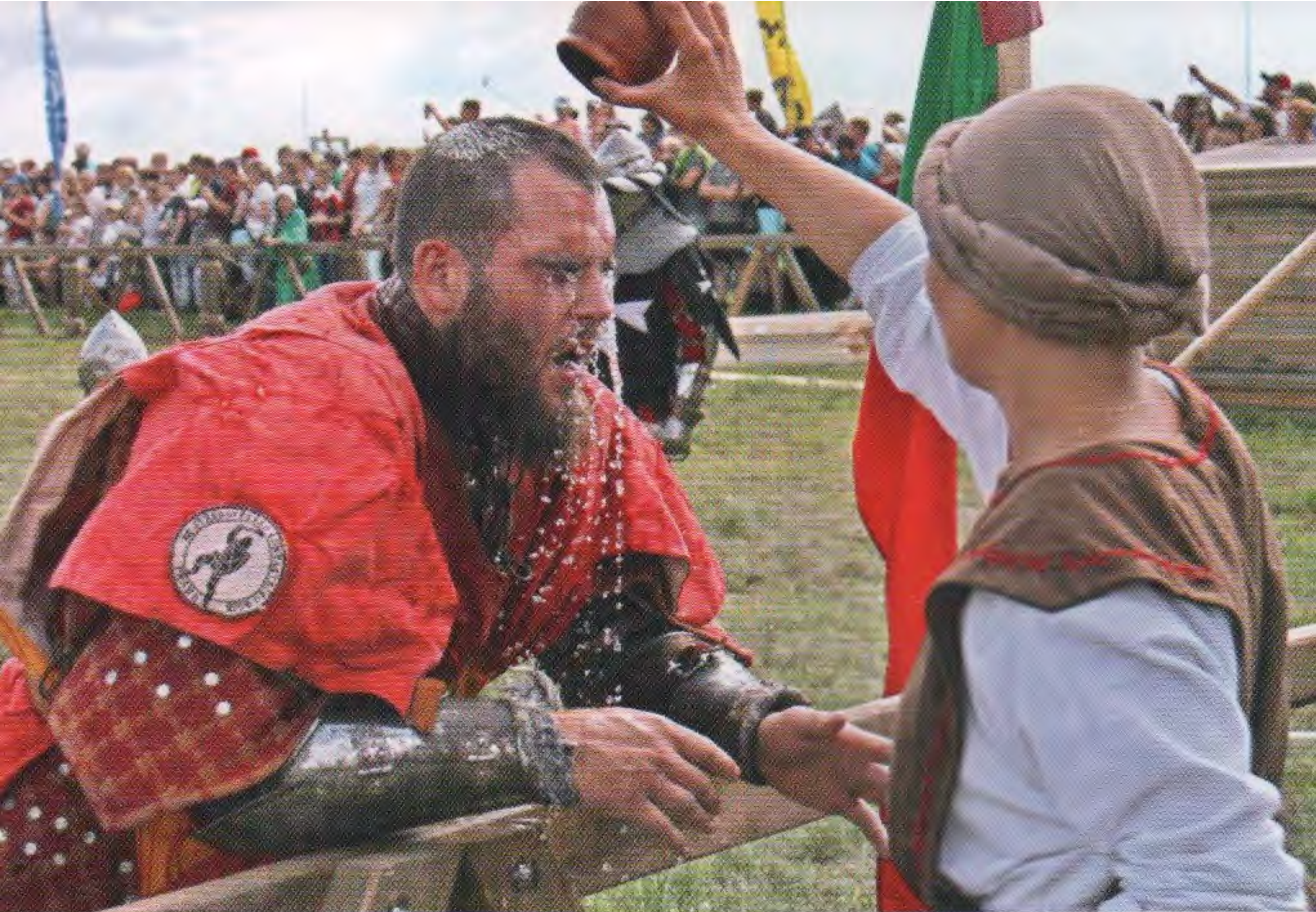
Фестиваль «Великий Болгар». 2017

Средневековью после каждого касания противника бойцы разводятся по сторонам. По позднему – бойцы бьются в течение двух-трех минут по нескольку сходов (раундов), и потом судьи считают, кто кому сколько ударов нанес.