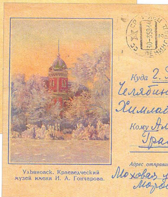
Ульяновск. Краеведческий музей имени И. А. Гончарова.

Краеведческий музей имени И.А. Гончарова на конверте выпуска 1957 года