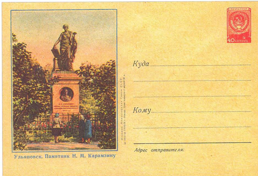
Ульяновск. Памятник Н. М. Карамзину