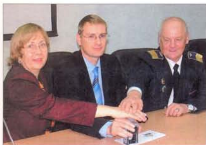
Первое торжественное гашение конверта, посвящённого 100-летию Героя Советского Союза И.Ф. Якурнова