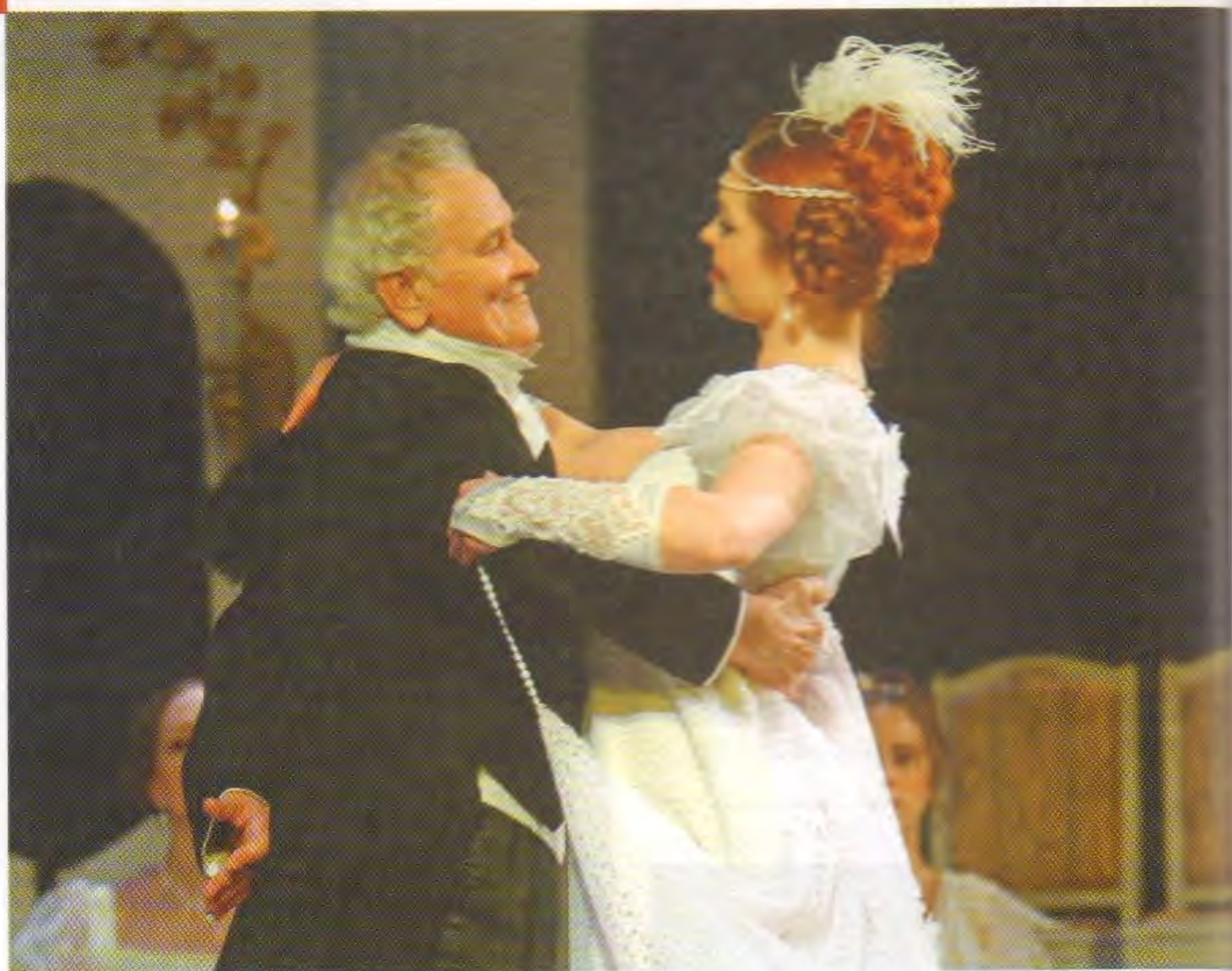
Князь Тугоуховский (А. Грибоедов «Горе от ума»)

В далёком 1966 году пришёл он сюда. Здесь, в одном из старейших театров, повидавшем на своём веку немало блестящих артистов, утвердиться оказалось непросто. Но у Дурова была хорошая школа: его учили профессии Андровская, Конский, Раевский, Кнебель. Высокий уровень артистизма, чувство ансамбля, искренность и полная самоотдача – вот лишь