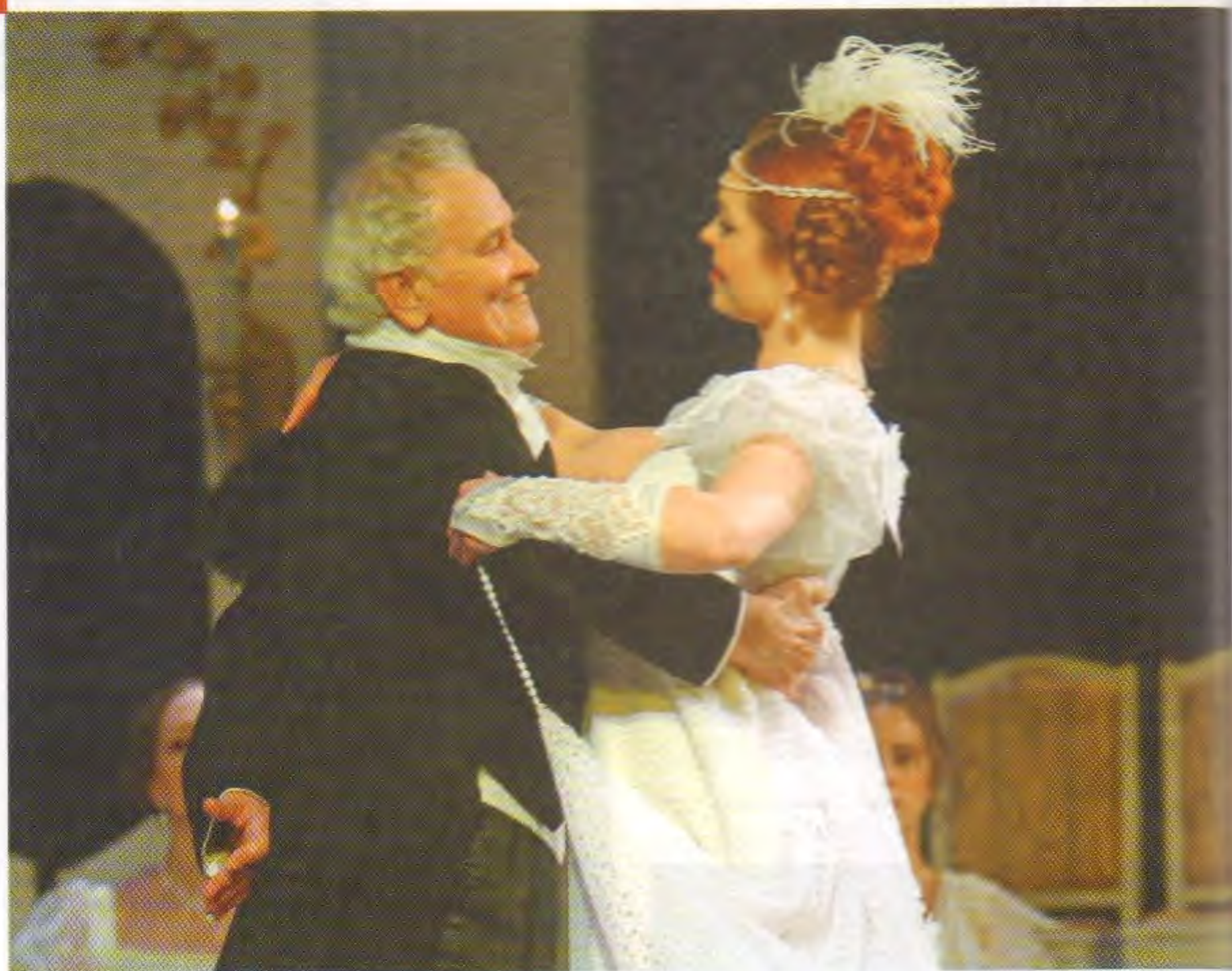
Князь Тугоуховский (А. Грибоедов «Горе от ума»)