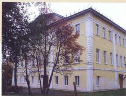
Дом Латухиных в Балахне

Балахнинские корреспонденты Н.М. Карамзина