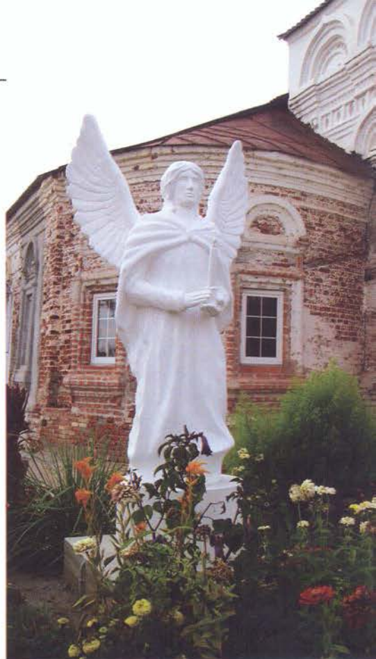
Рядом со Знаменской церковью в Балахне