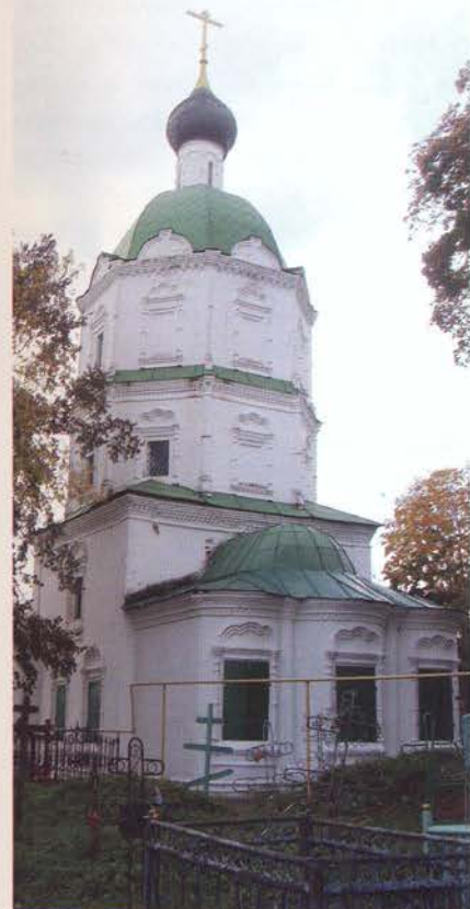
Троицкая церковь в Балахне, при которой похоронен Н.Я. Латухин

В середине XIX века о Петре Латухине писал и известный нижегородский краевед архимандрит Макарий (в 1866–1867 годах был епископом Балахнинским): «Богатый солепромышленник и поставщик казённых вещей в Санкт-Петербург», а В.Г. Короленко в своих очерках показал его неограниченную власть в Балахнинском магистрате, который он возглавлял, будучи бургомистром.