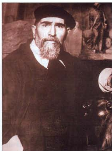
Автор памятника, скульптор Сергей Меркуров.

В центре Ульяновска, в стороне от шумных улиц, рядом с бывшей симбирской мужской классической гимназией и Карамзинским сквером, скромно стоит памятник Карлу Марксу. Вот уже 90 лет он обращает на себя внимание любителей истории, политики, искусства и просто прохожих. Незаурядность этого изваяния ощущается и специалистами, и дилетантами. И тому есть ряд причин: время его создания – первые бурные годы советской эпохи, гений ваятеля Сергея Меркурова, безграничная энергия Иосифа Варейкиса, сумевшего осуществить проект за полтора года, и, конечно, сама личность автора «Капитала».