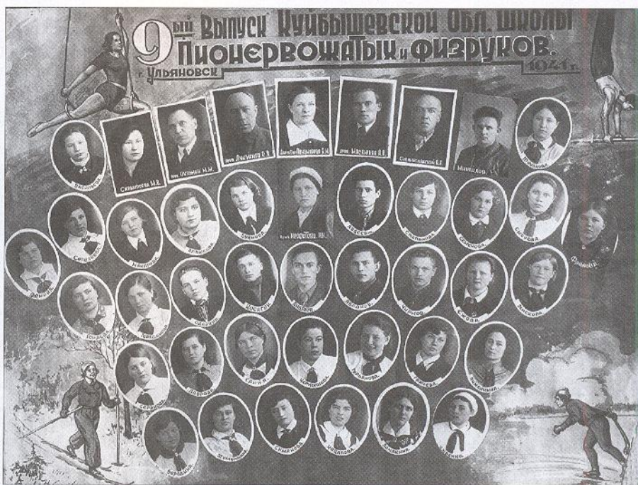
Выпуск Куйбышевской областной школы пионервожатых и физруков. Ульяновск. 1941

Чёрный хлеб стоил тогда 75 копеек за килограмм, но и этих копеек ведь не было... Мы голодали.