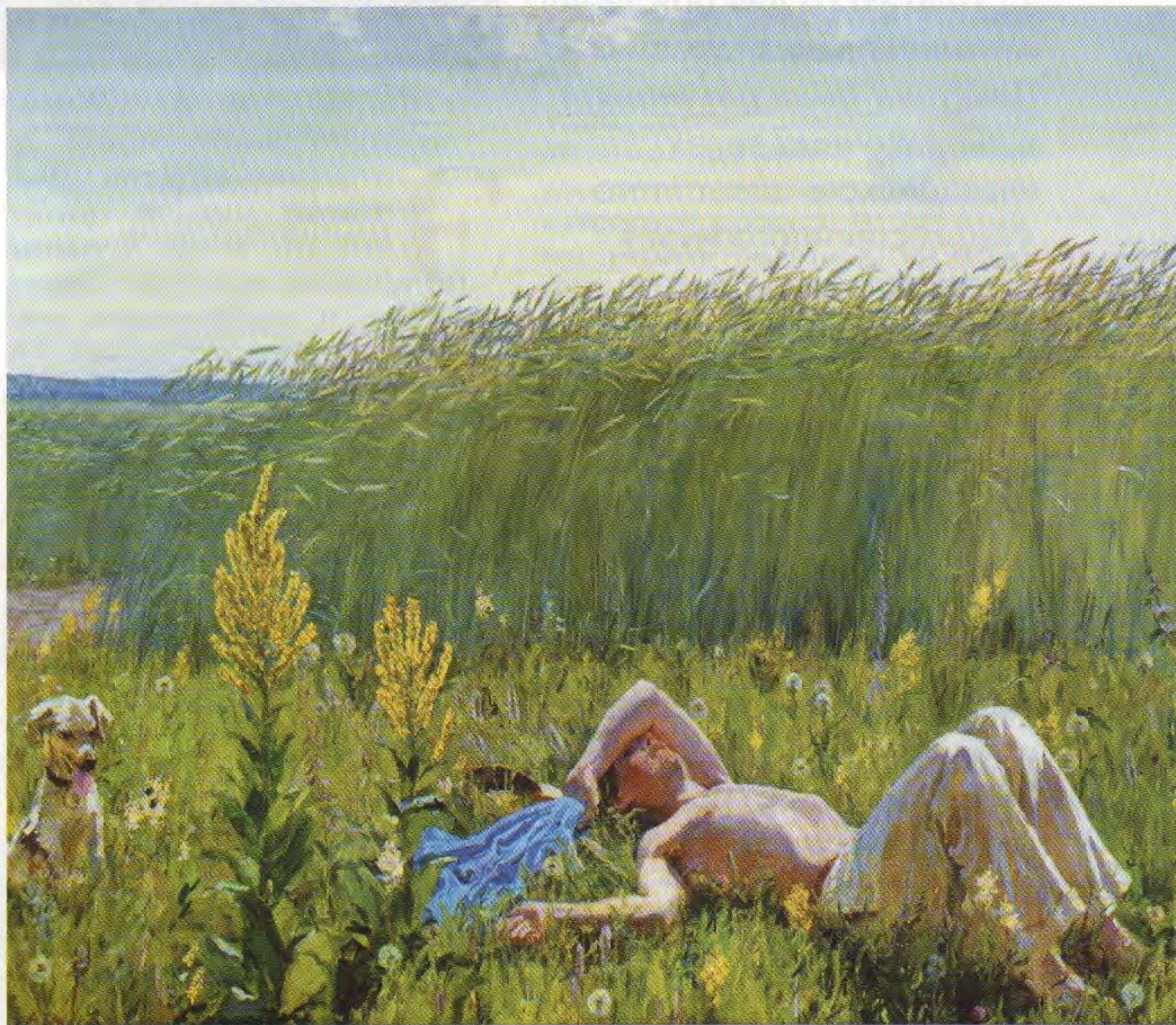
А.А. Пластов. Юность. 1953–1954. Государственный Русский музей

Подготовил Антон Шабалкин , ведущий архивист Государственного архива Ульяновской области