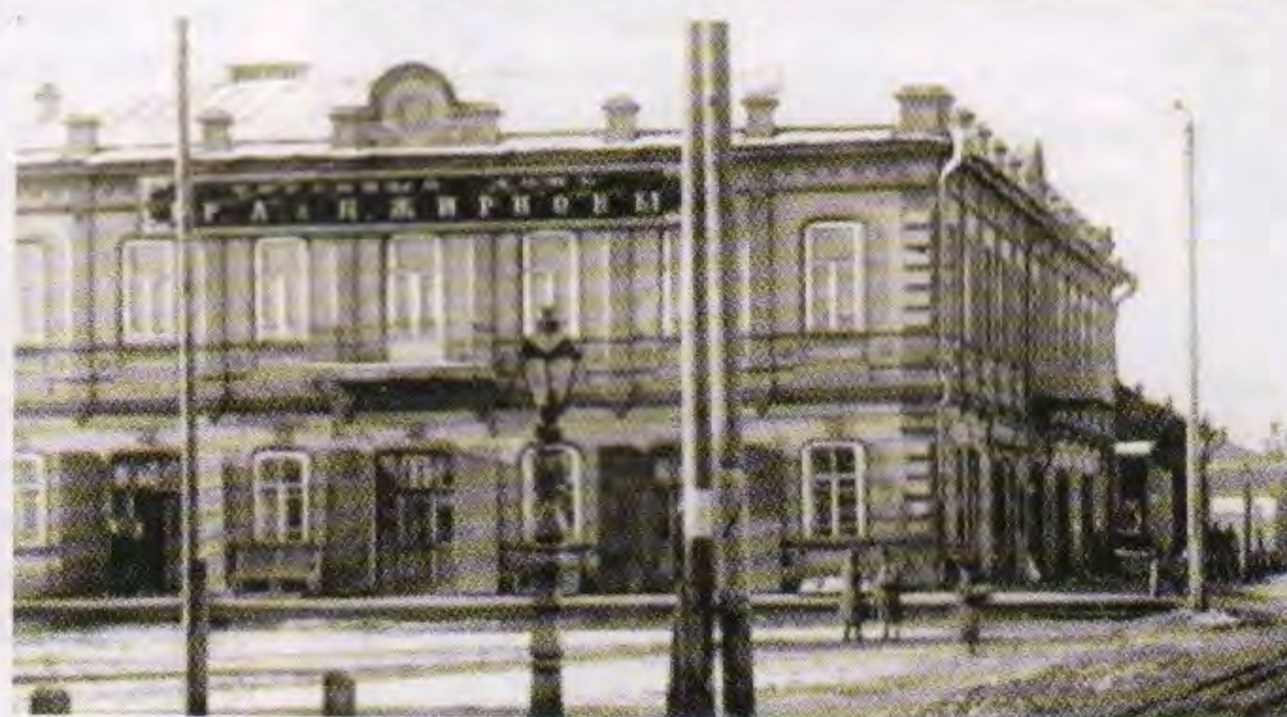
Дом Жирновых с молельней внутри

1892 года и одно дело 1898 года о старообрядцах Мелекесса.