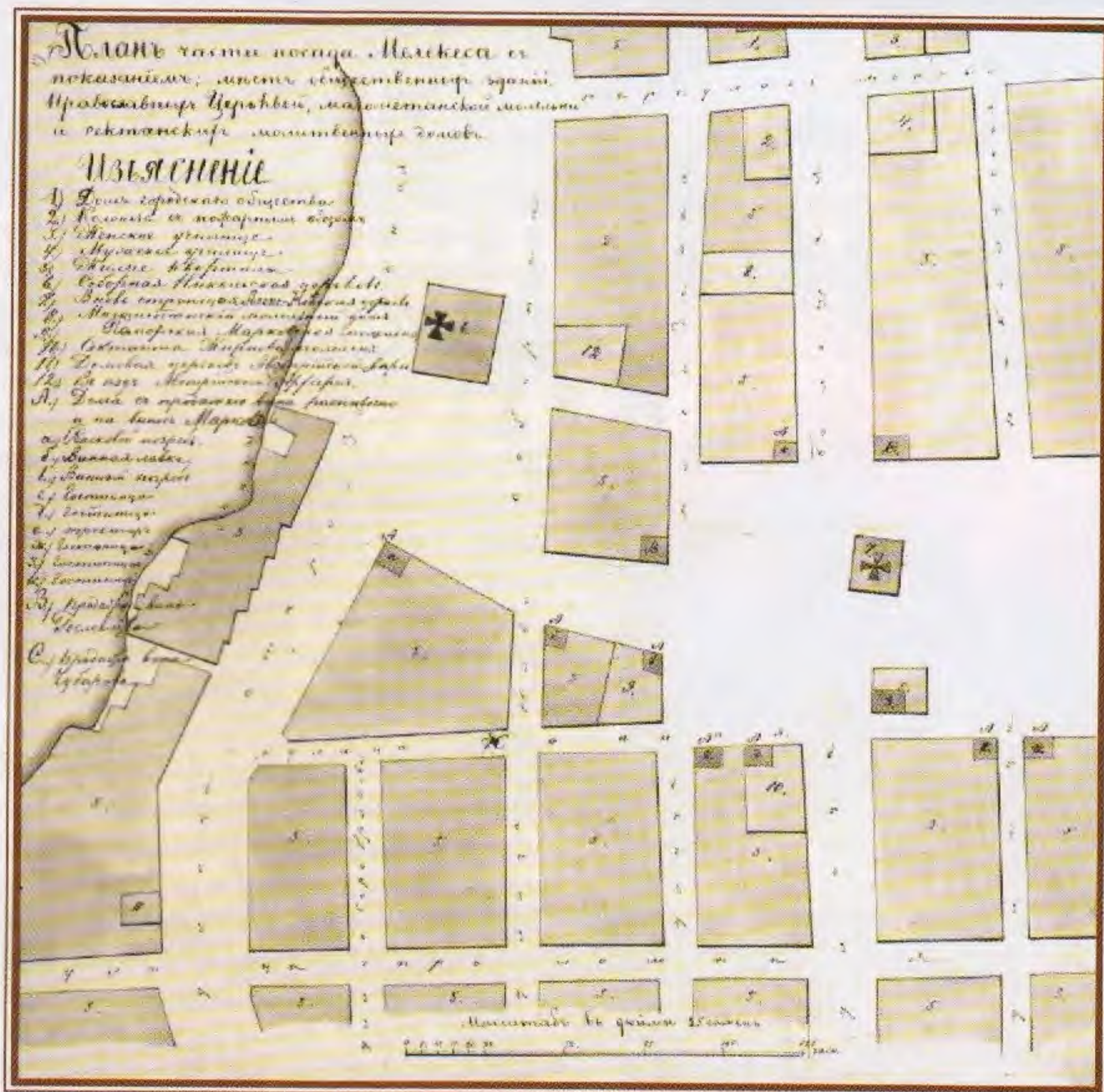
План посада. 1891

В Государственном архиве Самарской области хранятся два дела