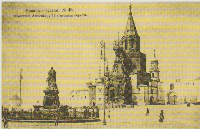
Казанский кремль. Открытка. Здесь находились юнкерские казармы