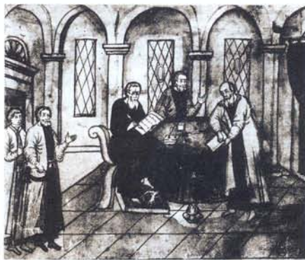
Приказные люди за работой. Рисунок из старинной рукописи

В 1627–1629 годах Кунаков служил в Приказе Большой казны с окладом в 10, а затем – в 14 рублей. В 1639 году упоминался в качестве подьячего Разрядного приказа. Здесь он занимался составлением первичной документа-