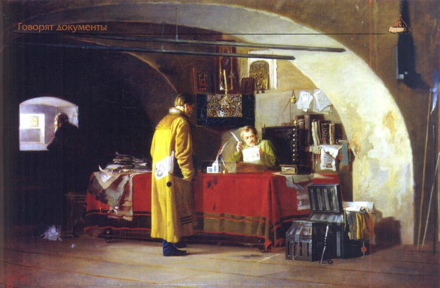
А.С. Янов. «Приказ в Москве в XVII в.». 1880-е гг.