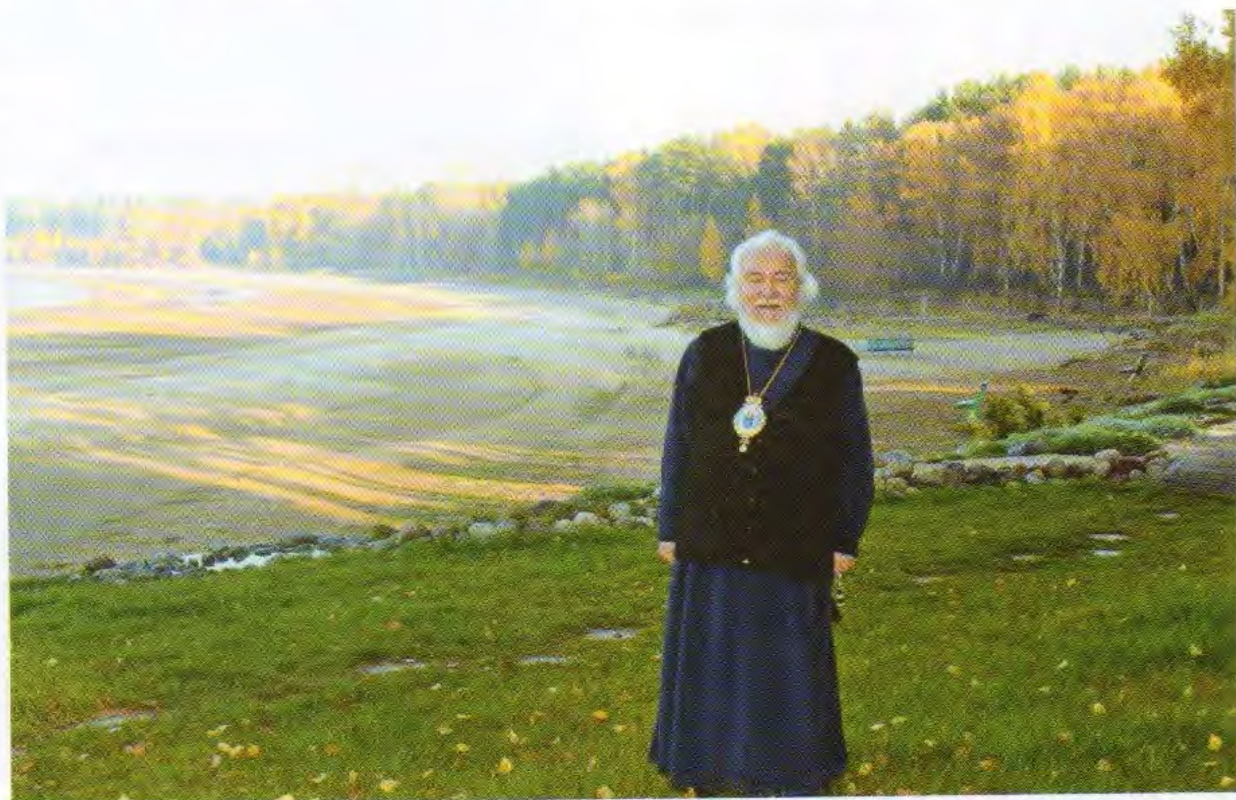
В день Покрова Пресвятой Богородицы. 2012

Время от времени мы встречались с владыкой, а однажды, находясь в его кабинете, я подошла близко к столу и увидела стоящий в рамочке портрет отца Павла Алексахина. «Вы знаете старца?!» – вырвалось у меня. «Я считаю его своим духовным наставником», – признался архиепископ. Я рассказала, что езжу в общину на послушание и очень люблю старца. В тот момент произошла перемена в наших отношениях, и в дальнейшем, до самого ухода владыки Прокла, я чувствовала его безграничную любовь.