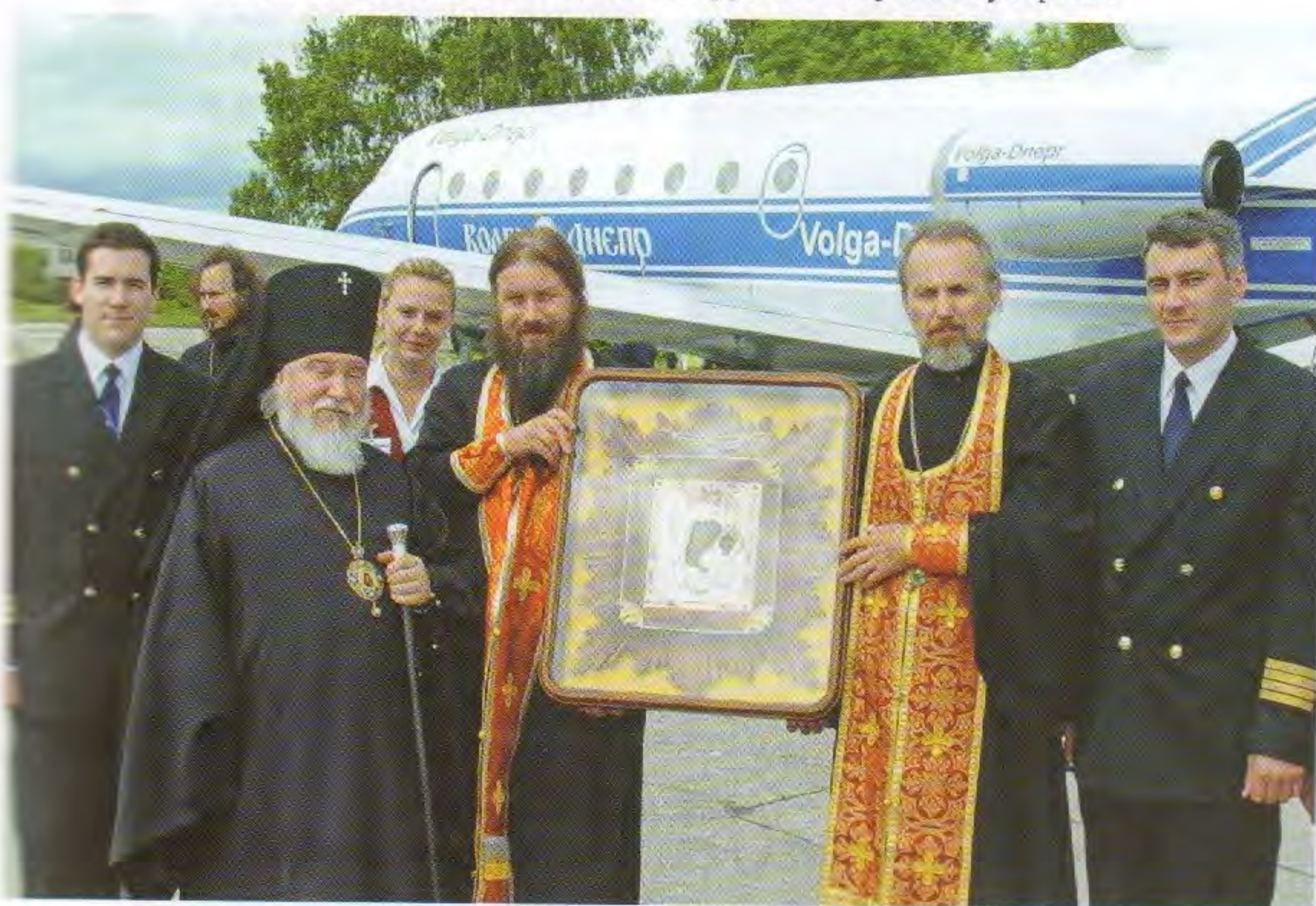
Воздушный крестный ход вокруг Симбирской губернии