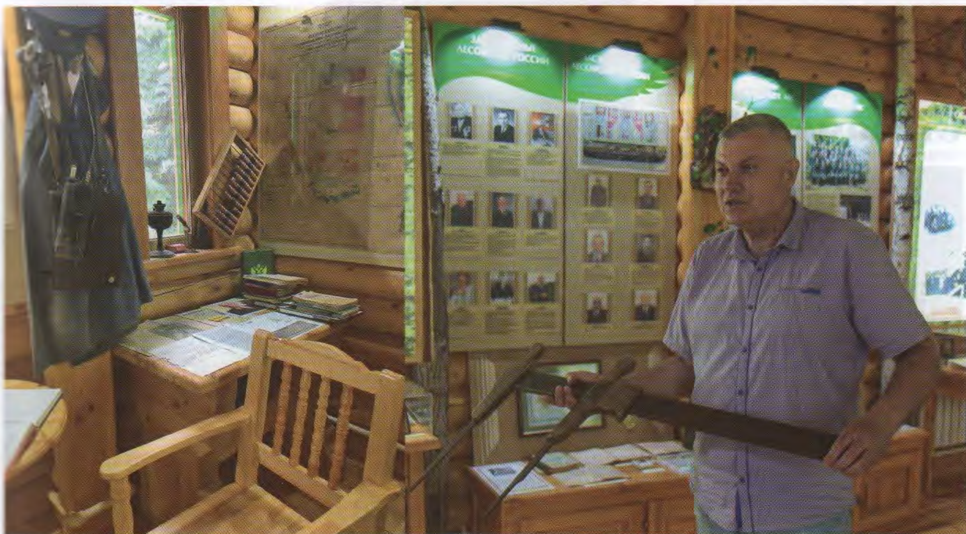
Рабочий уголок лесника