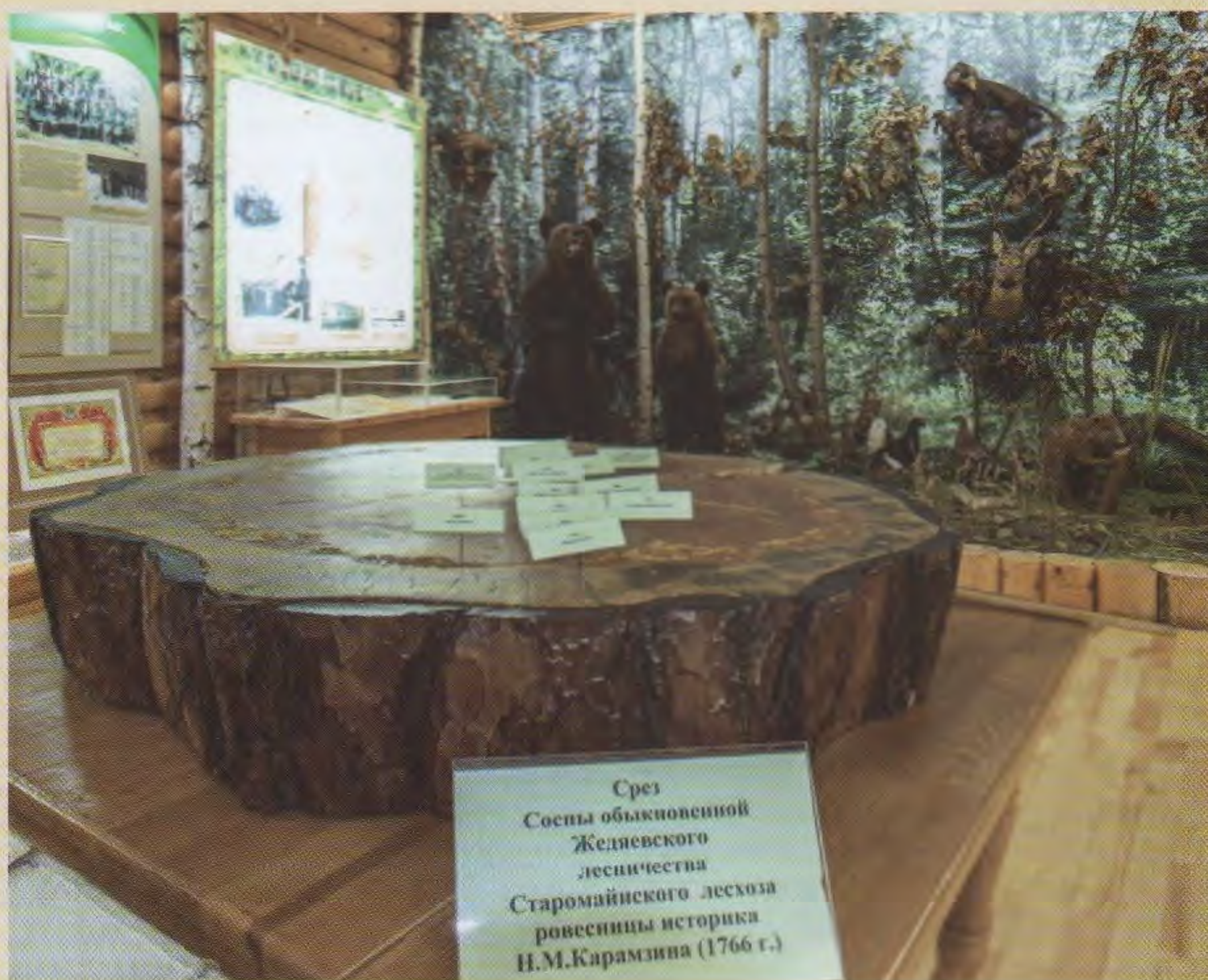
Срез Сосны обыкновенной Железского лесничества Старомайнского лесхоза ровесницы историка Н.М.Карамзина (1766 г.)

корабельные нужды... В 1901 году Императорское Русское географическое общество выпустило книгу "Россия. Полное географическое