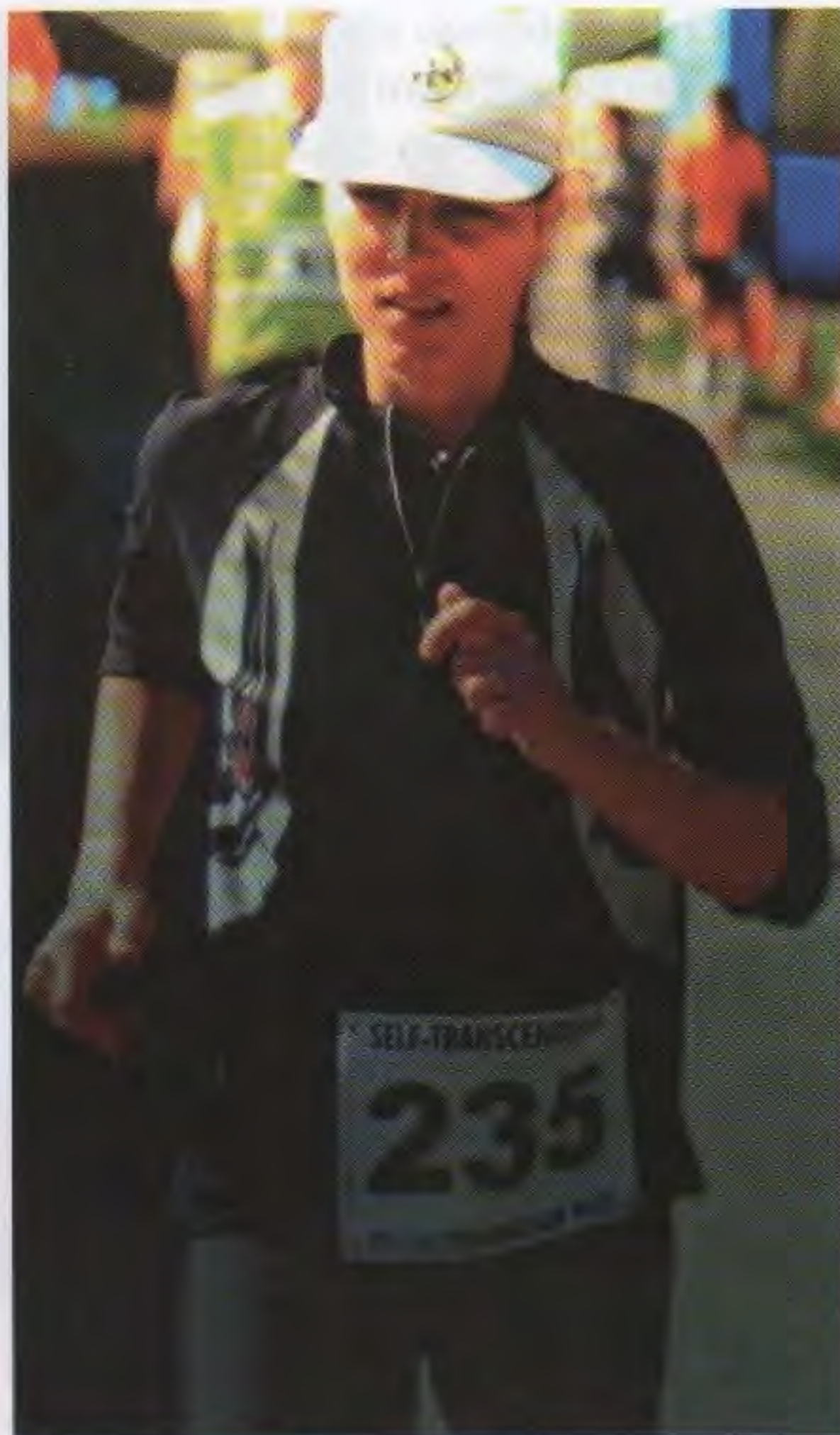
Швейцария, г. Базел, 2008

Прилетели в Цюрих, оттуда на электричке добрались до Базеля. Весь день Надежда пролежала на втором ярусе кровати с иконой Матроны в