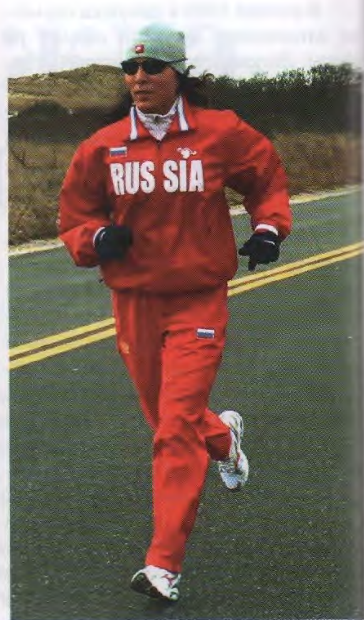
Штат Нью-Йорк, 2017

Никаких слов и эмоций не хватило, чтобы описать этот забег. Стартовали в 12 ночи. Температура воздуха +4. Предупредили, что днём будет жарко, придётся переодеться. Первые шесть часов она бежала вровень