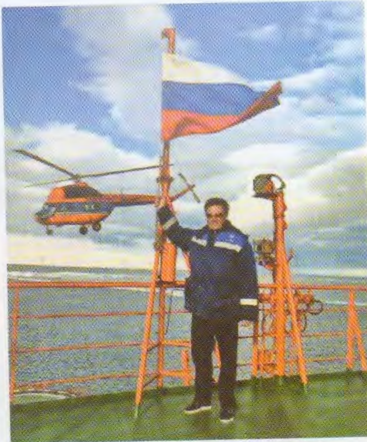
На Северном полюсе во время экспедиции на ледоколе «50 лет Победы». 17 августа 2017 года

Чтобы не расходовать лишних средств, отказались от штатных