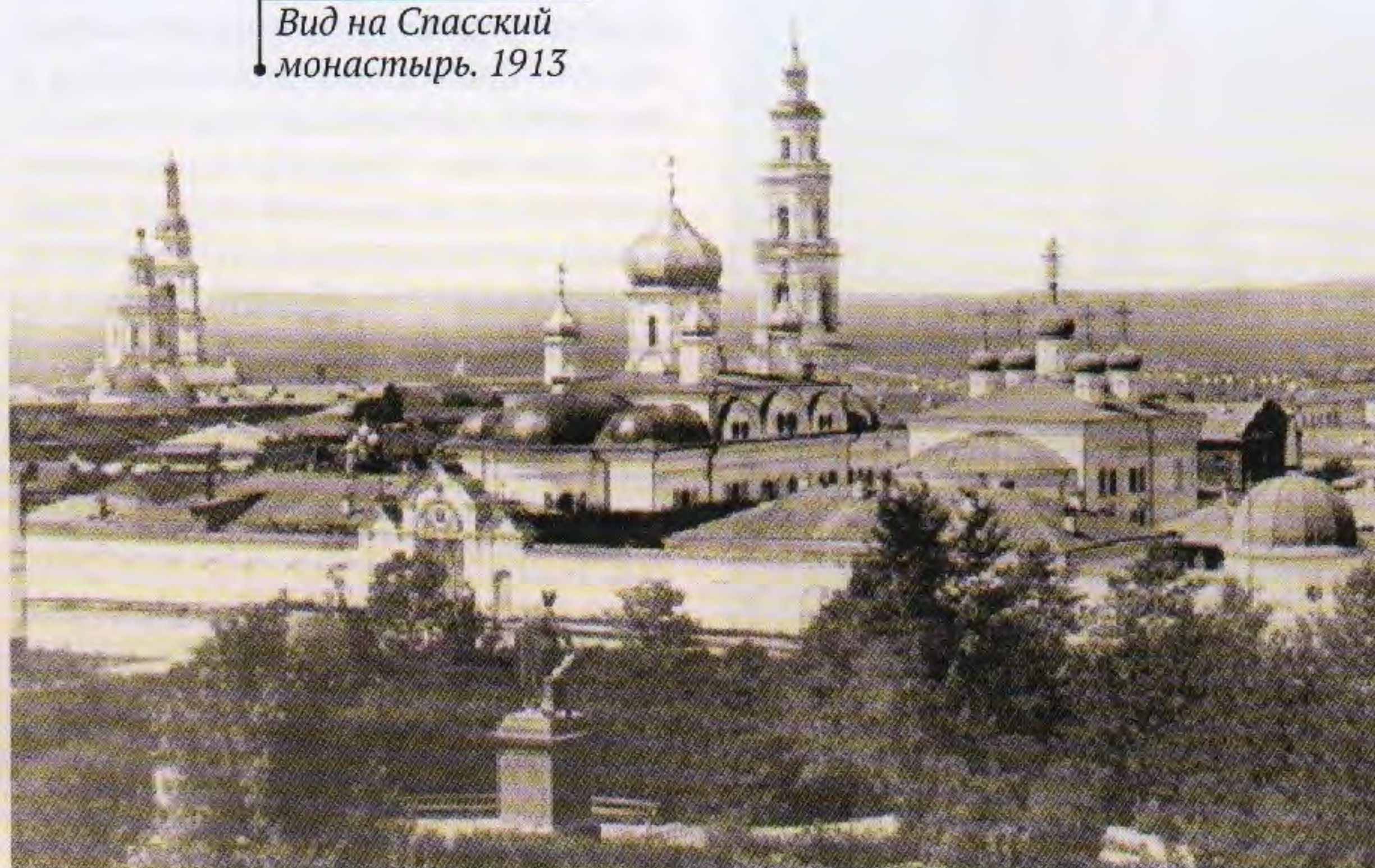
Вид на Спасский монастырь. 1913

В XIX веке историю обители подробно описал Капитон Иванович Невоструев (1815–1872), профессор Симбирской духовной семинарии. Вот некоторые из оставленных им сведений.