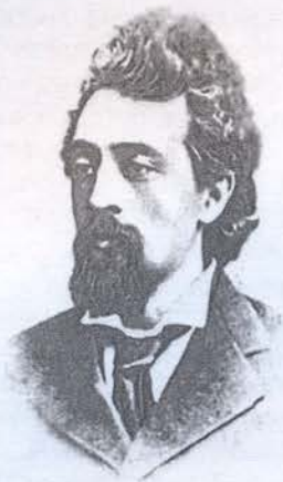
Дмитрий Николаевич Садовников (7 мая 1847 года, Симбирск – 31 декабря 1883 года, Санкт-Петербург)

«Имя Садовникова придавлено тяжестью жестокого русского забвения более, чем чье-нибудь: оно было вычеркнуто из памятных списков – даже сверстников-собратьев – чуть ли не на другой день после похорон талантливого поэта», – с горечью написал в 1900 г. видный симбирский литератор, этнограф, первый биограф и неутомимый пропагандист творчества Садовникова Аполлон Аполлонович Коринфский. Изменилась ли ситуация спустя более чем столетие после этих слов? Пожалуй. В разные годы выпущены в свет и переизданы избранные произведения поэта; фольклорные сборники, также переиздаваемые, являются непременно настольными книгами современных фольклористов. Вот только имена биографов поэта единичны. Крупнейшим среди них, после А.А. Коринфского, думается, следует назвать известного и уважаемого ульяновского краеведа Ж.А. Трофимова, который не только обратился к архивным документам, дабы восстановить детали жизненного и творческого пути Садовникова, но и два десятилетия назад предпринял попытку разыскания могилы поэта на петербургском кладбище Новодевичьего монастыря. Попытка, увы, успехом не увенчалась. У семьи Д.Н. Садовникова, работавшего в Петербурге в последние годы жизни и скоропостижно скончавшегося в декабре 1883 года в Боткинской клинике от крупозного воспаления легких,