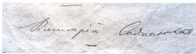
Автограф Д.Н. Садовникова. Из фондов УКМ