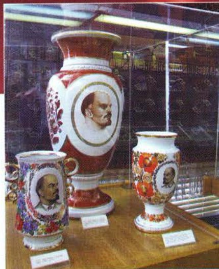
Вазы с изображением В.И. Ленина. Подарки от трудящихся Украины

– В наших планах создание исторического клуба «Патриот». На базе Ленинского мемориала уже действует военно-исторический клуб «Полигон», литературный клуб, клуб «Носфера». Это всё признаки реального гражданского общества, которое без