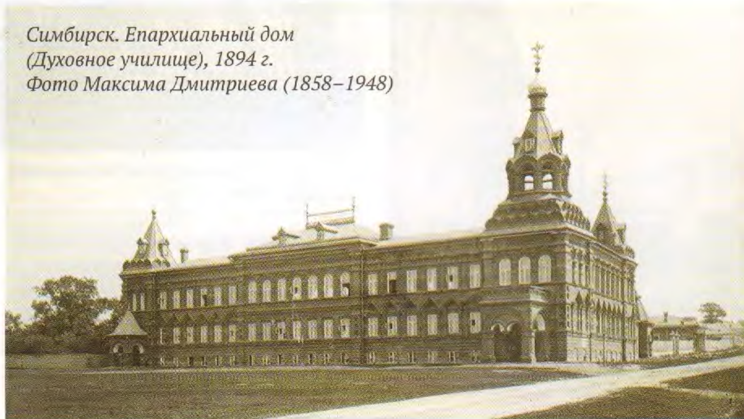
Симбирск. Епархиальный дом (Духовное училище), 1894 г.

вопрос о том, кому именно посвятить храм в строящемся здании училища. Депутаты предложили оставить этот вопрос на усмотрение архипастыря. Епископ Симбирский и Сызранский