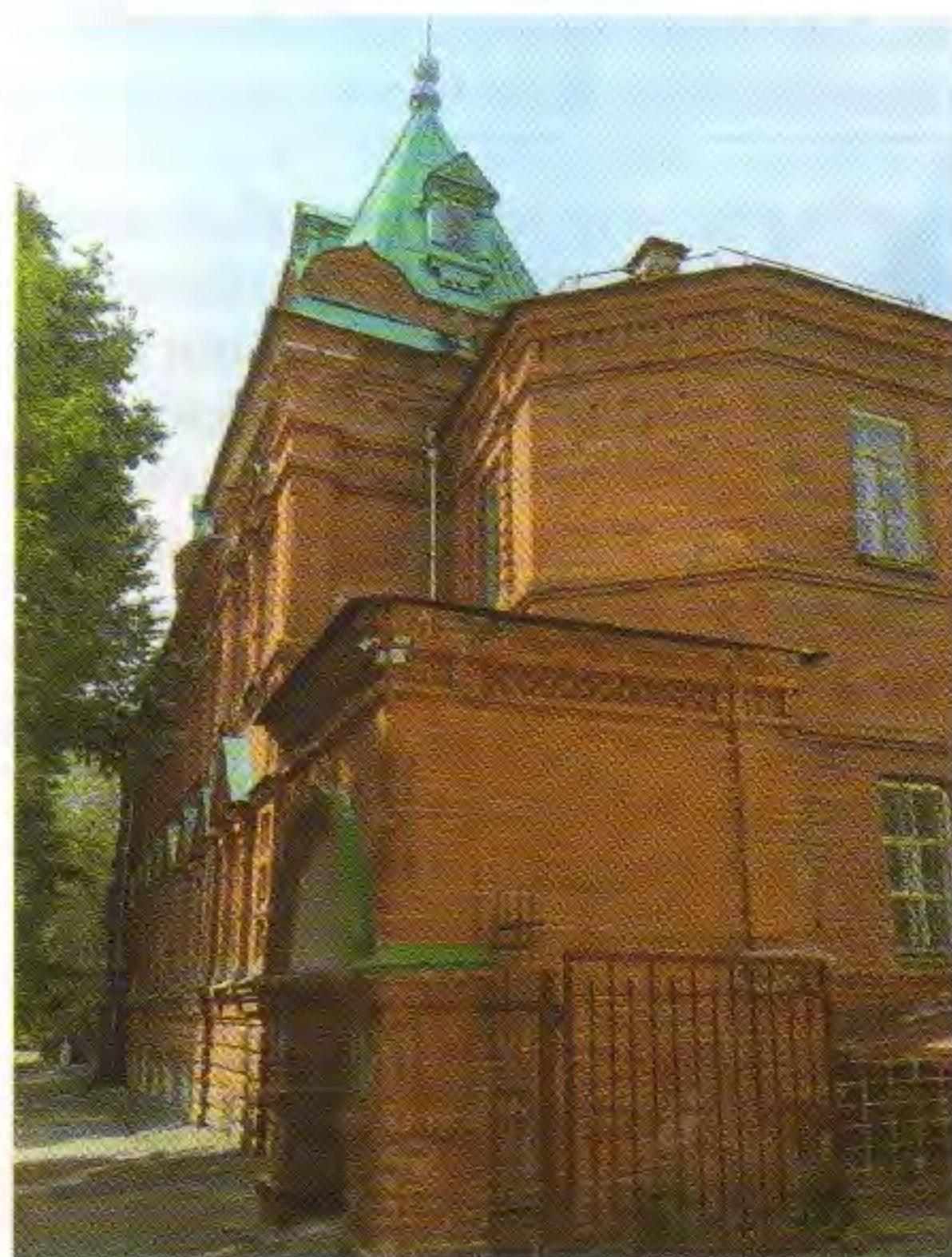
• Пятигранная апсида бывшей Кирилло-Мефодиевской церкви. 9 августа 2021 г.

Много лет ведутся разговоры о передаче всего здания бывшего духовного училища Русской православной церкви. В настоящее время проблема так и не разрешена. И потому особенно грустно видеть великолепную колокольню бывшей Кирилло-Мефодиевской церкви без колоколов. Это как тело – без души, человек – без сердца, мир – без благодати.