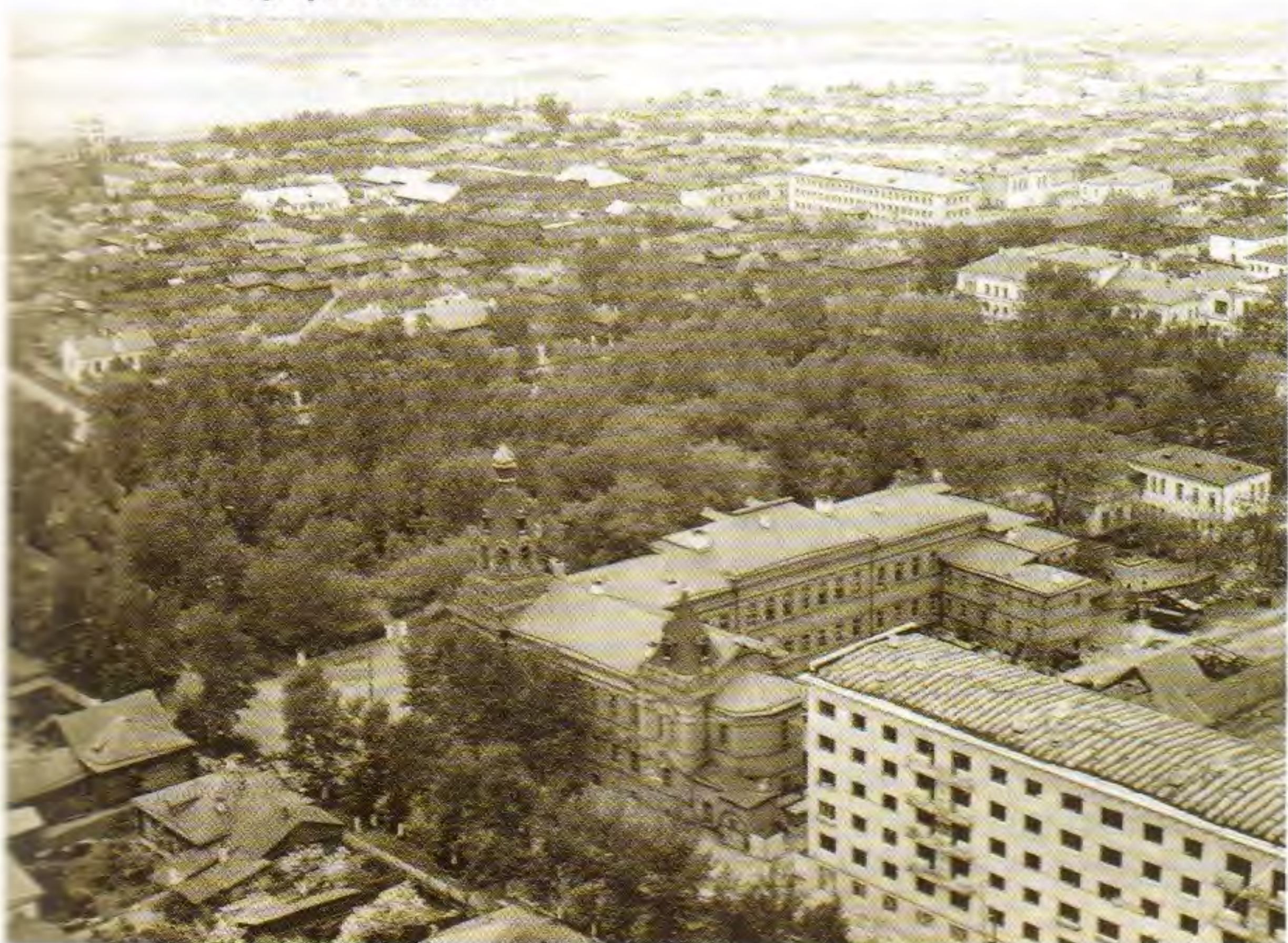
• Улица К. Либкнехта, Колючий садик. Начало 1960-х гг. Аэрофотосъёмка

В 2000-х годах в помещении бывшей Кирилло-Мефодиевской церкви находился актовый зал медицинского факультета УлГУ. В конце 2008 года благодаря совместной инициативе администрации УлГУ и Симбирской и Мелекесской епархии было принято решение устроить в одной из небольших аудиторий на первом этаже здания, имеющей отдельный вход с ул. Карла Либкнехта, часовню во имя