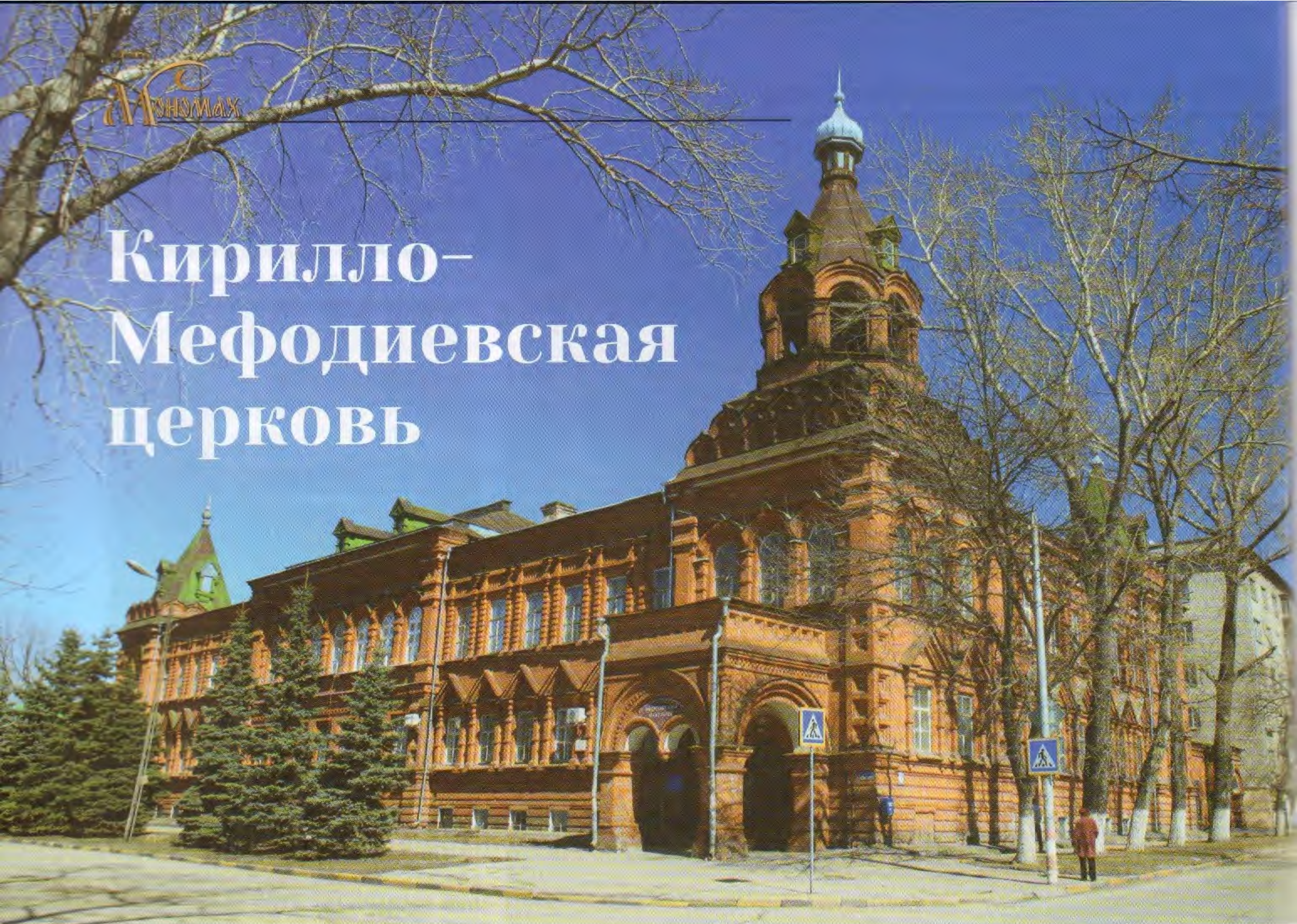
• Бывшее здание Симбирского духовного мужского училища. 14 апреля 2013 г.

В понедельник, 16 (28) августа 1893 года, в Симбирске случилось знаменательное событие: духовное мужское училище переехало в собственное новое двухэтажное здание «изрядной архитектуры». Оно было построено в 1891–1893 годах по проекту симбирского инженера и архитектора Михаила Григорьевича Алякринского на Николаевской площади, напротив Покровского (Благовещенского) мужского монастыря (ныне перекрёсток