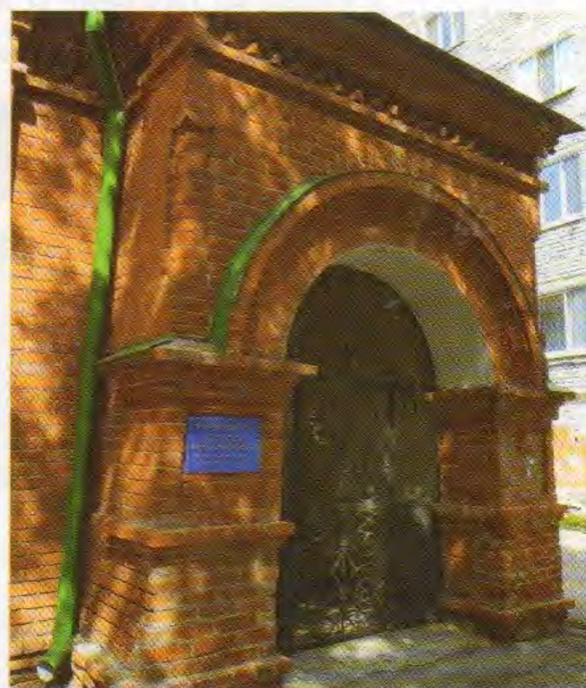
• Вход в часовню во имя святых равноапостольных Кирилла и Мефодия. 9 августа 2021 г.

святых равноапостольных Кирилла и Мефодия. Она была освящена в воскресенье, 24 мая 2009 года, – в день празднования Дня славянской письменности и культуры.