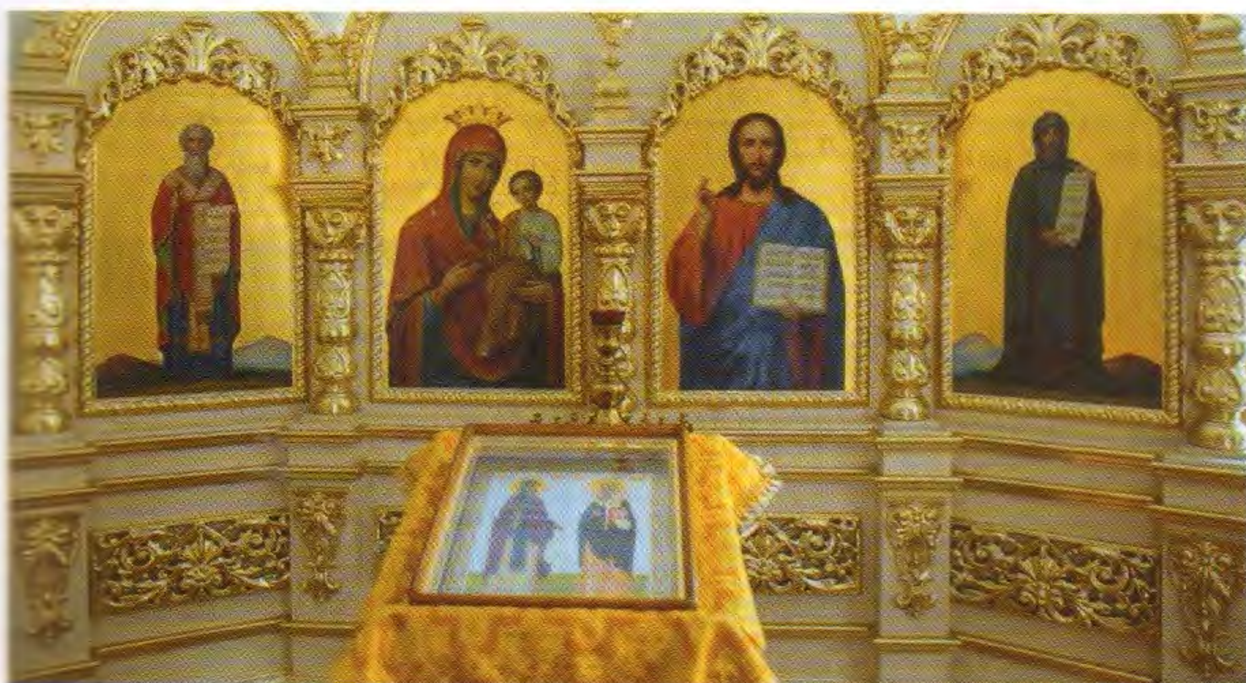
• Внутреннее убранство часовни во имя святых равноапостольных Кирилла и Мефодия

Варсонофий вынес резолюцию: «Новоустроенный храм посвятить имени и покрову свв. равноапостольных Кирилла и Мефодия», так как храма их имени в г. Симбирске ещё ни одного не было.