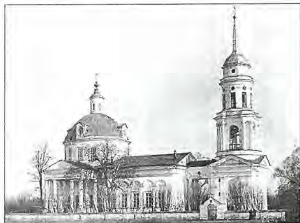
Церковь в Никольском. Нач. XX в.