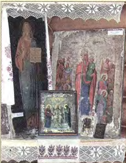
Иконы в музее Бряндинской школы