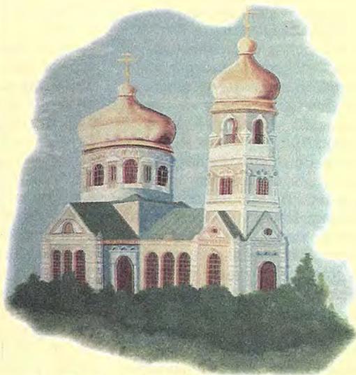
Бряндинский храм Параскевы Пятницы