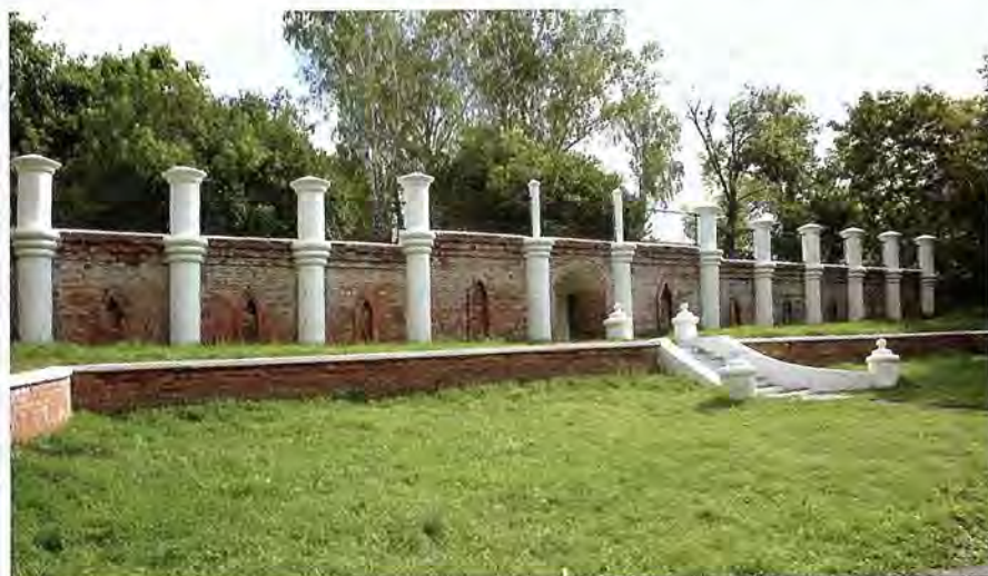
↑ Современное состояние усадьбы Языковых

евскими, Баратынским, Погодиным, Михайлович, Шевыревым. Не раз виделся с Пушкиным. Весной 1830 года Александр Языков писал сестре: «Пушкин у Весселя (семейное прозвище Николая Языкова) часто бывает, он большой забавник и доставляет нам много удовольствия». В конце января 1831 года Языков вместе с Пушкиным, Вяземским и Баратынским справляли у Яра тризну по недавно умершему Дельвигу. Через три недели Пушкин накануне своей свадьбы устроил у себя мальчишник – прощание с холостой жизнью. В числе десяти ближайших друзей был и Языков.