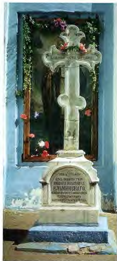
Памятник Н.И. Ильминскому у храма Ярославских Чудотворцев в Казани

Иван Яковлевич Яковлев в автобиографии «Моя жизнь» посвятил