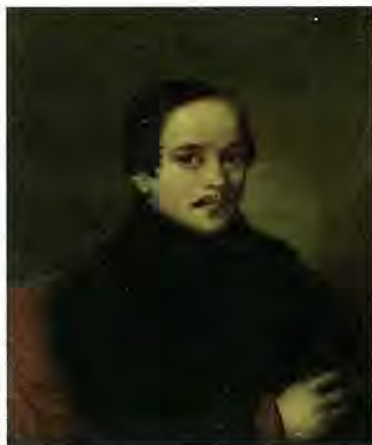
М.Ю. Лермонтов. Худ. П.Е. Заболоцкий. 1839 г. Санкт-Петербург, Литературный музей – Институт русской литературы РАН

Встречался ли Денис Давыдов с Михаилом Лермонтовым в Саратове? Ссылаясь на мемуары П.М. Медведева (известного театрального антрепренера второй половины XIX века), саратовский краевед и литературовед Л.И. Прокопенко в 1960-е годы утверждал, что среди гостей на свадьбе присутствовали «сестра Афанасия Столыпина Елиза-