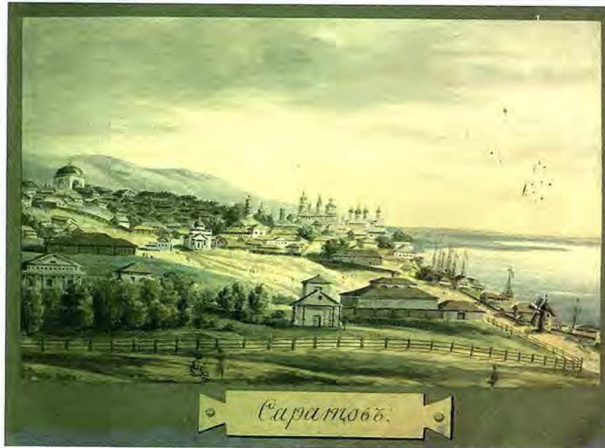
↑ Саратов. 1830 г. Акварель неизвестного художника

моего приезда сюда отправился с Колокольцевым в Саратовскую губернию, в Балашовский уезд для осмотра участков имения гр. Разумовского, которое все осмотрели с ног до головы; там Колокольцев меня оставил, и я на возвратном пути в Пензу осмотрел имение Рахманова и заезжал к Бекетову <...>. Ты видишь, что я погружен весь в отыскание имений, достойных покупки. Разумовского участки мне и Колокольцеву очень понравились, но главный недостаток их в том, что сбыт хлеба затруднителен, ибо оно от Саратова в 180-ти верстах <...>. Если Зиновьевка (Колощина) не понравится мне и имение Облезовой также, то лучше подождать. Кто нас гонит?»