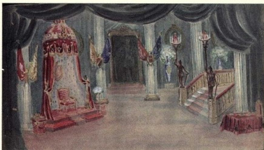
Эскизы декораций Я.В. Глинки к театральным постановкам на ульяновской сцене