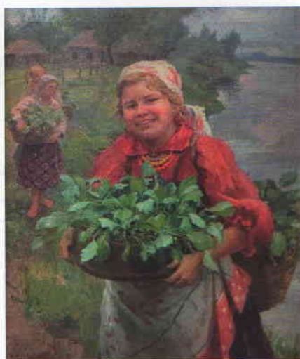
•Девушка с капустной рассадой. 1930

В 1910-е годы работы Федота Сыčkova уже имели успех не только на выставках в России, но и в парижских салонах, где они охотно раскупались любителями живописи. Крестьянские девушки и барышни Федота Сыčkova по популярности не уступали барышням Константина Маковского. В непростую эпоху социальных потрясений и противоре-