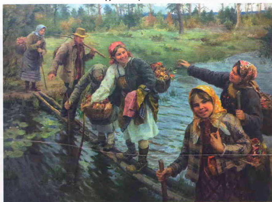
•Трудный переход. 1932

Все эти темы нашли отражение в экспозиции выставки в Ульяновске, где представлено 30 произведений из фондов Мордовского республиканского музея изобразительных искусств им. С.Д. Эрьзи: эскиз картины «На мосту» 1890-х годов, «Рим. Форум Романум» 1908, «Пастушка» 1913, «На посиделки» 1925, «Трудный переход» 1932, «Праздничный день. Подруги» 1929, «Соня» 1923, «Катание с гор» 1947, «Зимой» 1925, «Цветы» 1940, «Подружки» 1935 и другие. Любовь к мордовской культуре привела к серии ярких работ, посвящённых представителям коренной национальности: «Мордовка», этуод к панно «Праздник урожая» 1937, «Эрзянка» 1930-е.