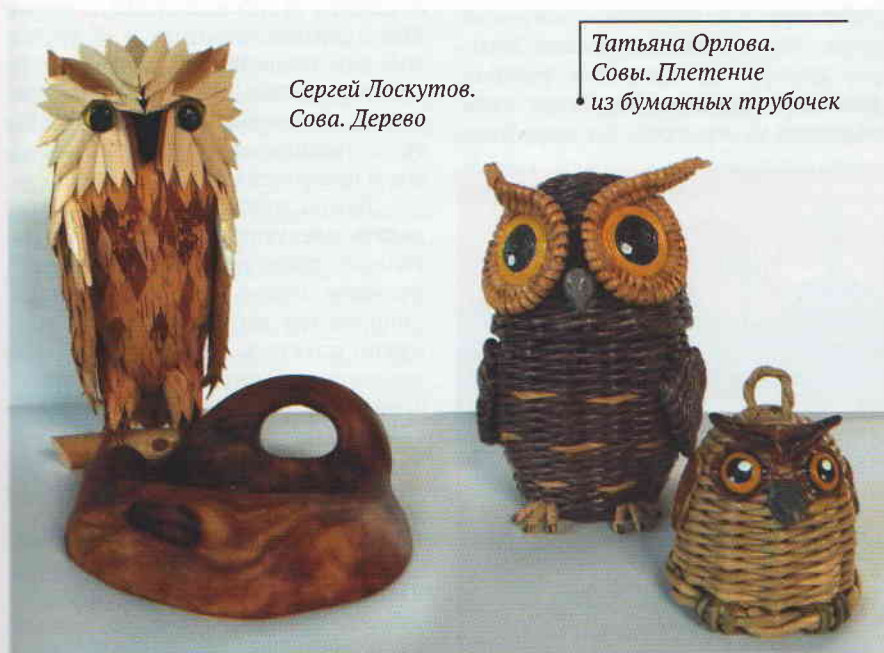
Сергей Лоскутов. Сова. Дерево