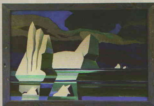
Фёдор Конюхов. Айсберги