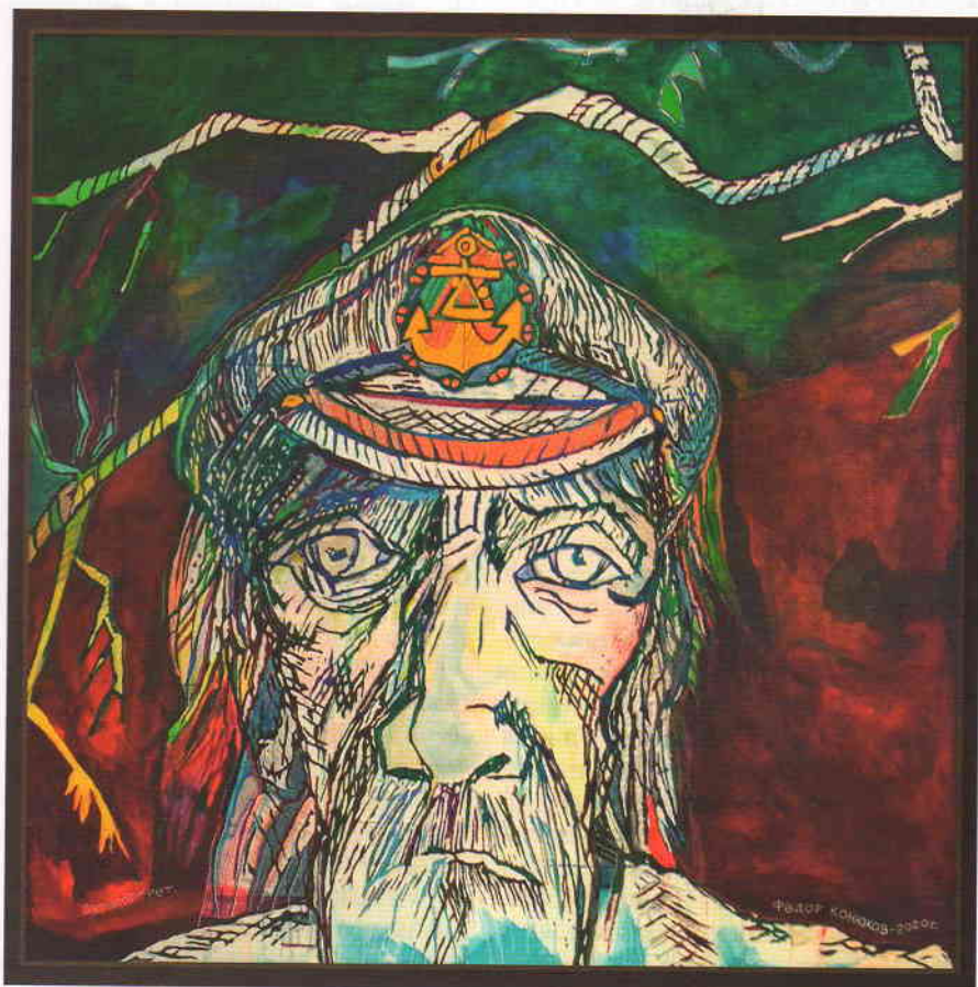
Фёдор Конюхов. Автопортрет

В год культурного наследия народов России в Музее народного творчества (филиал ОГБУК «Центр народной культуры Ульяновской области») были организованы уникальные выставочные проекты, в которых принимали участие мастера и художники из г. Ульяновска и области. Актуальность замысла, нестандартное решение в построении экспозиции, креативные экспонаты привлекли особое внимание авторов и посетителей музея.