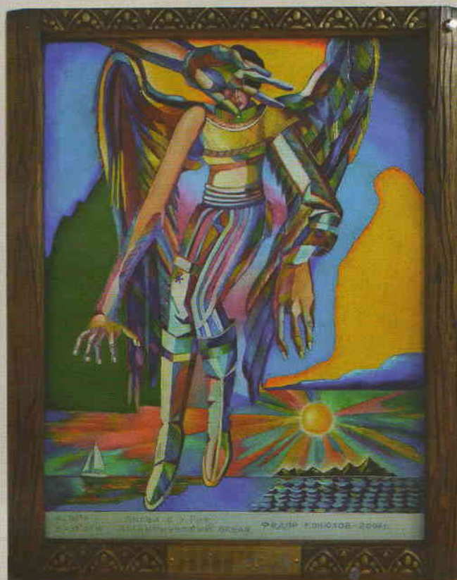
Фёдор Конюхов. Ангел острова Гоф