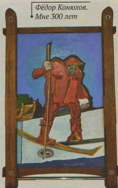
Фёдор Конюхов. Мне 300 лет

Представленная экспозиция объединила живопись и графику автора и является частью художественной коллекции, которая охватывает три десятилетия путешествий Фёдора Конюхова по всему миру – от ранних работ, написанных в 1970–1980-е годы, до картин, созданных в 2000–2020-х годах. Это сюжетные картины и портреты, анималистические мотивы и свободные пейзажные импровизации, масштабные, экспрессивные, отмеченные условностью живописного решения и порой тяготеющие к чистой абстракции.