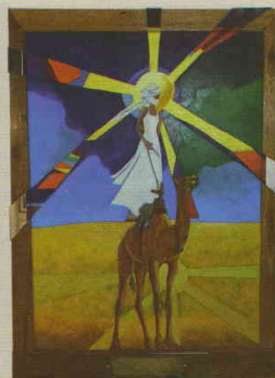
Фёдор Конюхов. Мираж