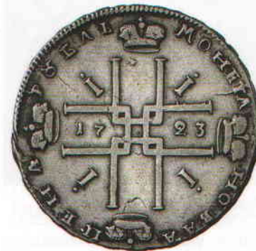
«Крестовик». Серебряная монета номиналом в 1 рубль (28,25 г). 1723

две недели пьянствовал, да денег взял шесть с полтиной, а толку не было.