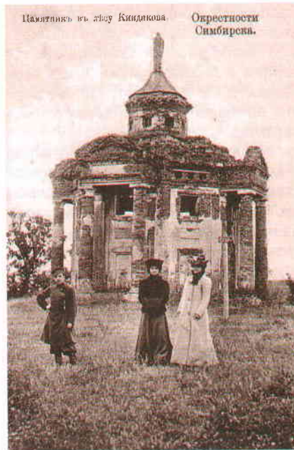
Окрестности Симбирска. Киндяковская (или Массонская) беседка]

Вышеупомянутая беседка, по его словам, сооружена ещё в середине прошлого XVII столетия над прахом одной родственницы семейства