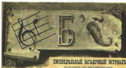
Источ.: Ребус. – 1884. – № 18 (6 мая). – С. 1

Ко всему вышесказанному мною я должен присовокупить, что вследствие моих наблюдений оказалось, что различных колдунов и знахарок в Симбирской губернии можно встретить только из числа нищих, редко зажиточный мужик, который не приобрёл денег сказанным шарлатанством, но трудом и работою, согласится обманывать народ колдовством и ворожбою, все упомянутые нами колдуны получили своё происхождение из кабаков, и редкий из них имеет деньги, проживая собранные за колдовство гроши. Таковые люди даже не могли бы иметь места в наших деревнях при особенной религиозности народа, если бы суеверный страх быть испорченному не препятствовал мужикам изгонять из среды своей столь вредных тунеядцев.